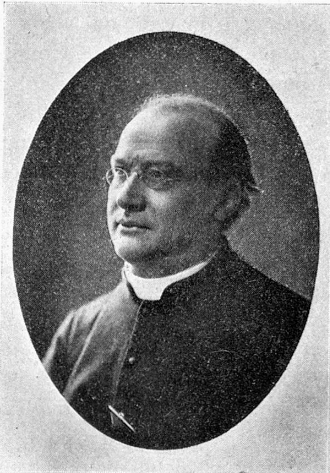
† Decanatedral R. Mod. Tuor.

per igl uestgiu! 52 onns de tala veta sacerdotala. Cun buna raschun ha dompropst Willi en siu classic plaid de bara ils 20 de Fevrer 1912 schau passar quels 52 onns avon la scantschala principala digl uestgiu sco onns fretgeivels e pleins