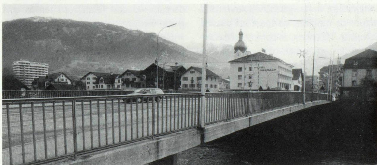
La destrucziun dalla punt veglia, in segn caracteristic dil marcau, ei stada l'entschatta d'ina midada rapida dil vegl maletg dil marcau.

ner, casas da confecziun e seria e hotels sco ualers ni chalets surdimensiunai. Exempels: Tujetsch, Mustér, Falera, Laax, Flem. In cass per sesez ei Glion, igl emprem marcau sper il Rein. Lez han ei entschiet a reveder da rudien ils davos onns, buca per avantatg dil maletg dil marcau.