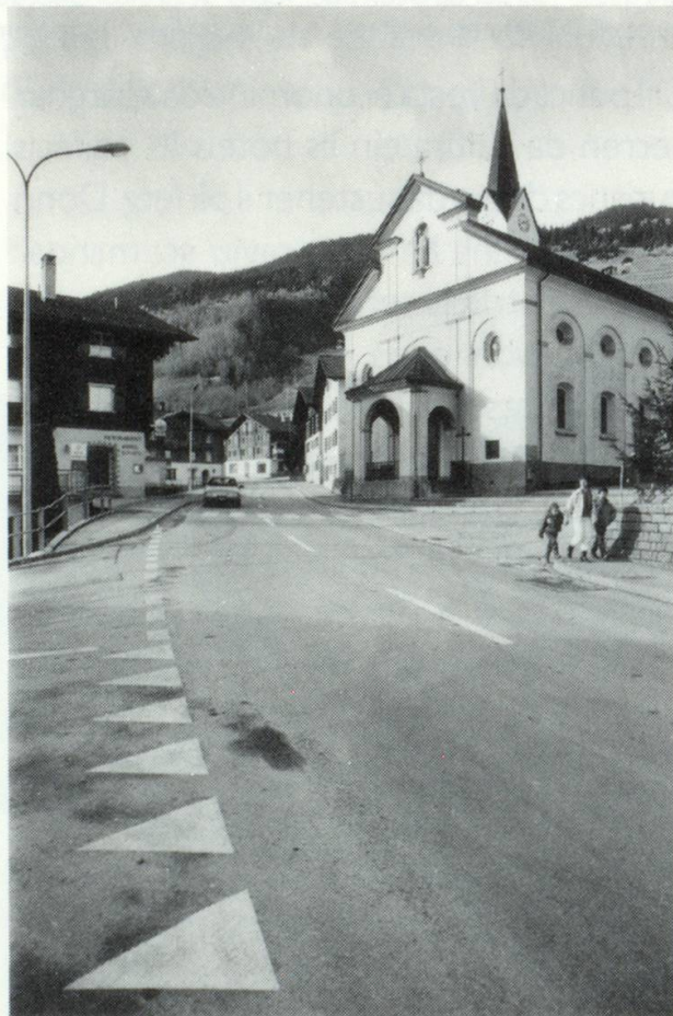
Vias spartan vitgs. Il traffic sminuescha la qualidad da viver. La canera crescha onn per onn ed ei certs dis quasi nunsupportabla.

Ilis Grischuns han ditg protestau encunter l'introducziun digl auto en nies cantun. Oz piteschan biars vitgs d'in traffic da transit quasi nunsupportabel. Ilis pedunzs e habitonts ston untgir en las chinettas ed audan buca igl agen plaid, sch'ei vulan discuorer cul vischin ni culla vischina. Ilis plazs avon baselgia, inaga loghens da cusseida, ein daventai plazs da parcar. Els vitgs