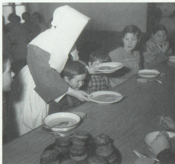
Jenischs ella casa d'affons

va buca presentar silmeins in document ni ina inscripziun ufficala en in register da batten svizzer ni en in cudisch parochial, vegneva spedijs sur ils cunfins; en quella maniera han ins savens scarpau dapart las famiglias. Quels ch'eran aunc restai anavos suenter quella procedura ein vegni reparti sin ils cantuns e leu puspei sin las vischnaucas, senza risguard als giavischs ni la derivonza dils pertuccai. Allas vischnaucas pli grondas eis ei reussiu, cun pagar ina summa da pauc, da renviar quels novs burgheis buca giavischai allas vischnaucas vischinas las pli pintgas e las pli paupras, el Grischun per exempel a Murissen, Vaz sura, Selma ni Landarenca. Talas vischnaucas eran buca hablas da porscher ina basa d'existenza als novs burgheis, il cuntrari, ellas han exclus els dal diever digl uaul, dallas pastiras communalas e dallas alps. Las persunas naturalisadas sfurzedamein en ina vischnaunca havevan pia l'alternativa u da daverntar fumegls e fomitgasas dad alp dils purs ils