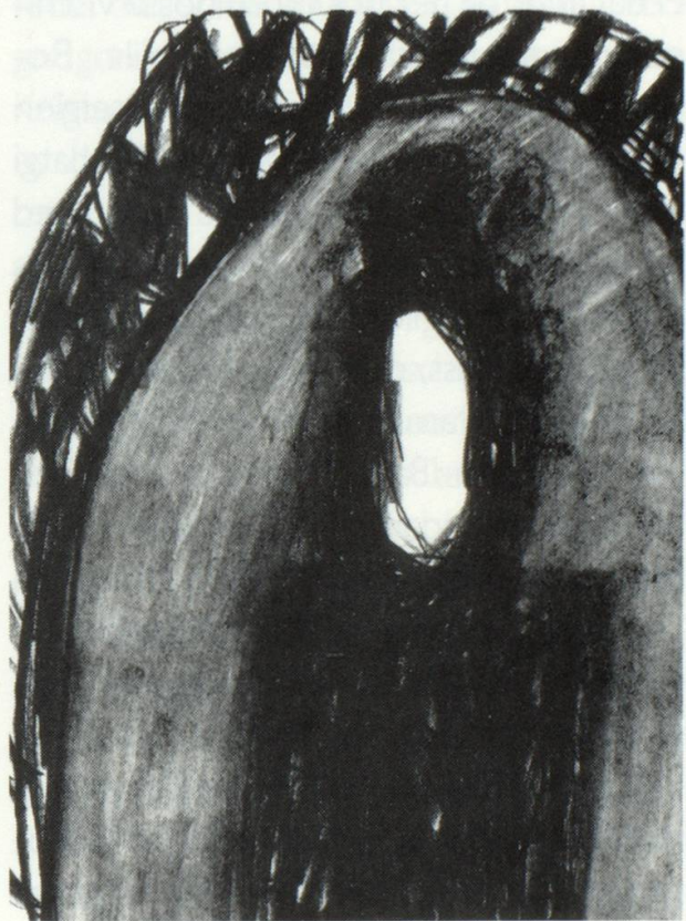
Dalunsch in desiert cun in grond crap. El tarlisch. Cotgla ardent.