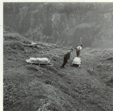
EB, Val Sogn Pieder

In buob davon ed in davos. Enamiez la vacca sut il giuv: tut quei per ina carga roma. Quel ch'empela il bov aulza il tgau e surri egl apparat. El ha temps. Il temps para de star eri. Ual sco la menadira. Aber ella semova. Omisdus buobs passan ual sil pei senierster ed aulzan il dretg per far in pass anavon. Era la vacca semuenta en quei tact, sia umbriva tradescha ella, aber aschi plaun ch'igl empalader sto buca ver tema de vegnir suten. El aulza il tgau e surri egl apparat. Ei han temps. Tgi che va cun ina carga roma sa buca haver prescha. El stretg spazi de quella veta muntagnarda ha il temps lartg e bien. Sin nossas vias ladas cun lur menadiras spertas ha el buca plaz pli. Il temps vegn laguttius dalla prescha. Sco sch'el fuss enta peis a nus «fagein nus ir» il temps, ed aschia eis el negliu perpeis pli. Quels buobs han lur tec roma che smarschescha els uauls, ed il temps va en melli scalgias en nossas olmas.