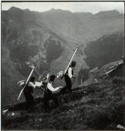
EB, Val Sogn Pieder