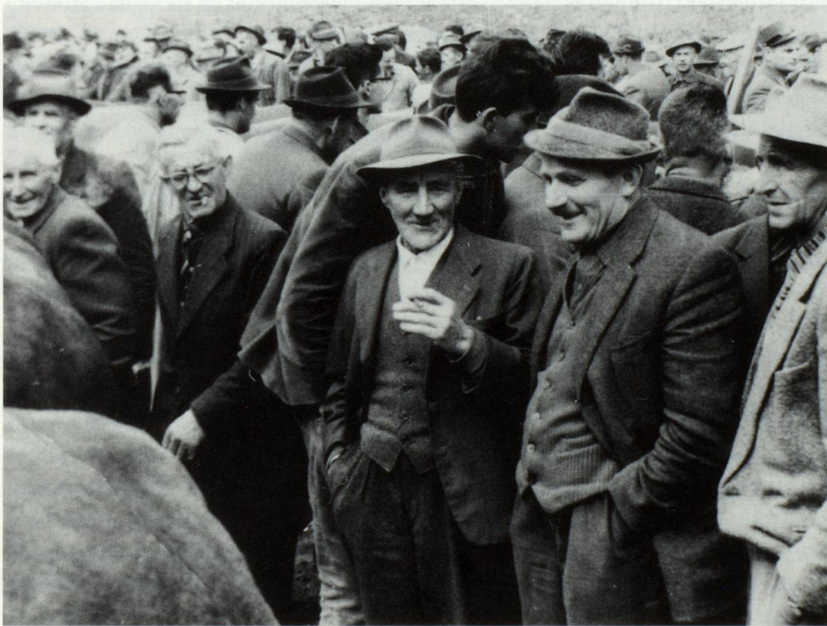
In ambient preferiu: Il specialist el center denter bia gliued ad exposiziuns da biestga

Basta cun quei vess jeu; jeu vess aunc giu, liu risdar enzatgei sur da quei ch'jeu erel cun, ch'jeu erel aunc fumegl cun quei pur cheu a Lumbrein. E quei che plascheva a mi il meglier, cura ch'jeu erel cun quei pur, era igl unviern cu nus eran sin quels cuolms e pervesevan. La sera gnevan nus lu ensemen e fagevan empau legher e devan empau jass e risdavan si da quei e risdavan si da tschei. Basta, ina sera ei lu era in vischin gnus lu era tier mei a vitg e sche ha el lu era entschiet risdar: ier sera hagi el giu propi in curios cass. El vevi ... la caussa era ida schia, gie: el eri ius si quella sera a perver, sco el scheva e pervesiu tochen tier il mulscher e lu per sesez veva el quels vadials e la galeida vevi el giu mess en sut letg. E lu cura che el ha giu da mulscher, eis 6 el lu tunschiu en per la galeida e grad pegliu ella miarda da gat.