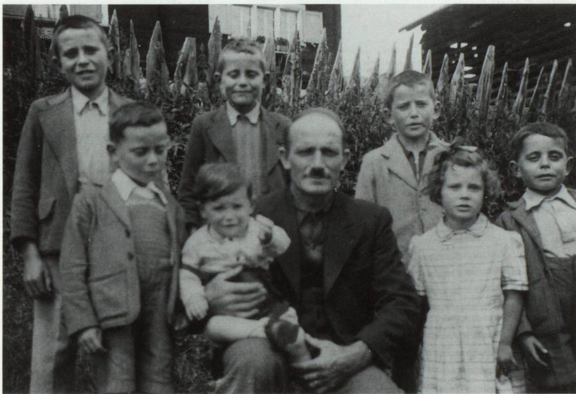
Il vieu cun siat da ses affons 1951