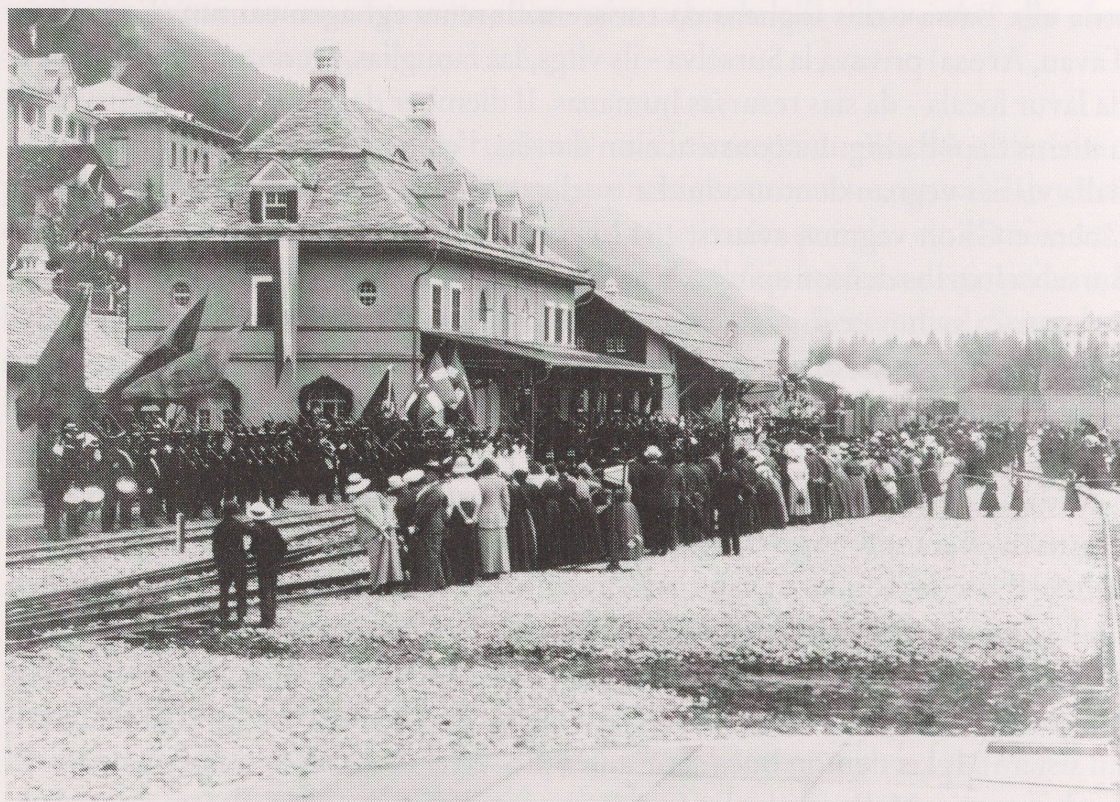
Emprem d'uost 1912: igl'emprem tren vegn beneventaus alla staziun da Mustér

Alla fin dil 19avel ed all'entschatta dil 20avel tschentaner ei la situaziun denton semidada marcantamein el sector da artisanadi e mistregn. Novas professiuns ein naschidas, ina part dallas veglias ei svanida. Cun la producziun da massa industrial e l'avertura da fatschentas da spediziun ha ei dau ina dira concorrenza. Ils