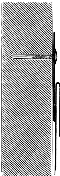
Natürliche Größe. Die oben an das Deckblech angelöthete, auf die Dachschalung genagelte Hasfte im Längenschnitt dargestellt.

Die bekannte New-Yorker Maschinenbau-Firma von R. Hoe u. Co. gibt im „Scientific American“ einige praktische