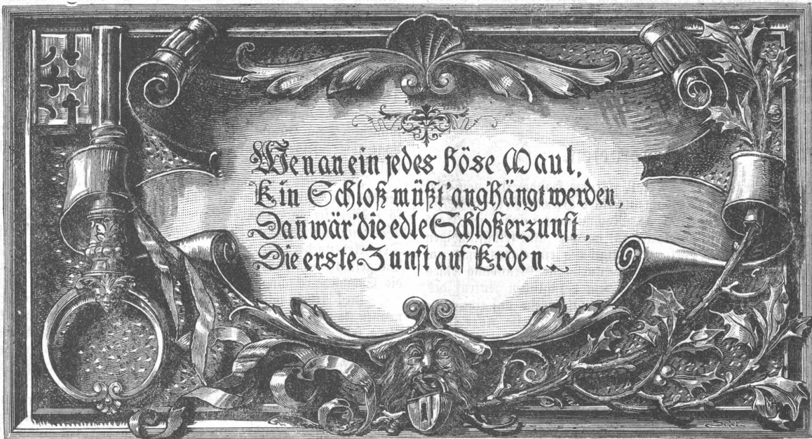
Aus dem Werke: „Allegorien und Embleme“ von Gerlach u. Schenk, Wien, Mariahilferstr. 51. (Siehe den Text.)