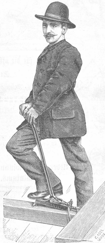
Fußbodenlegeapparat, Patent Pleße.

oder Reparatur unterliegen. Außerdem endlich sichert der Pleße'sche Fußbodenlegeapparat weit vollkommeneren Arbeit, als bisher erzielt werden konnte, da er die Dielen viel fester zusammenpreßt, als solches bei irgend einer der bisherigen Methoden möglich. Daß wiederum hierdurch auch das Entstehen der breiten Dielenfugen, und somit das Eindringen von Feuchtigkeit, Schmutz und Staub und die hierdurch bedingte Erzeugung gesundheitswidriger, gährender Substanzen sehr vermindert wird, dürfte unzweifelhaft erscheinen, und nicht unwesentlich zu Gunsten der Pleße'schen Werkzeuge sprechen. Alle diese vielen Vorzüge haben dem Apparate schnell zu weiterer Verbreitung verholfen, so daß schon jetzt mehr als 8000 Exemplare desselben in Deutschland, Oesterreich, Rußland, in der Schweiz, Belgien und in Dänemark im Gebrauche sich befinden und ihre Anwendung in dem Maße zunimmt, wie sie in ihrer Einfachheit und Trefflichkeit mehr und mehr bekannt werden. Für alle Architekten, Bauunternehmer, Zimmer- und Tischlermeister wird das überaus nützliche Instrument bald unentbehrlich sein.