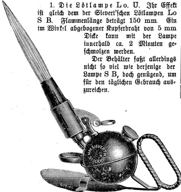
Fr. 11.— per Stück.

Die gewöhnlichen Typen der Siebert'schen Apparate werden zur Genüge bekannt sein, weshalb wir hier nur einige Neuheiten der Firma Max Siebert wiedergeben. Es sind diese speziell: