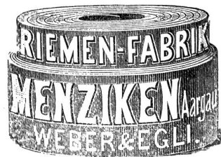
Goldene Medaille Thun 1899. Telephon.

Neuer Schlagriemen (Anti-Chrom-Gerbung) 230 vorzügliches Fabrikat, la Ledertreibriemen.