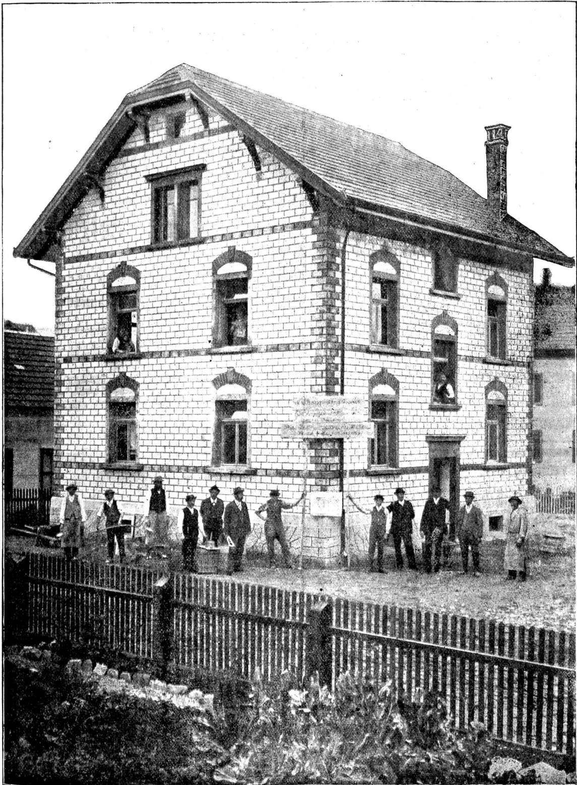
Haus, gebaut aus Verblendsteinen, welche mit Detiker's Handapparat hergestellt wurden.

geraume Zeit mehr verfloßen, als für die Zustellung der bestellten Kunststeinmodelle Herr Detiker bei seinem Besuch glaubte beanspruchen zu müssen, bemerke Ihnen,