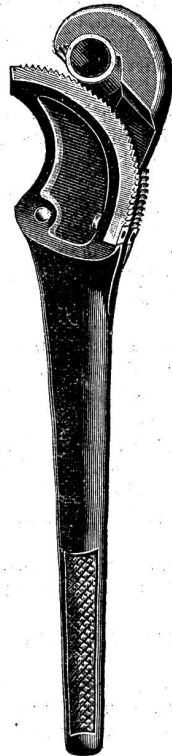
Fig. 3. Autom. Rohr-Schlüssel.

Anschließend sei hier noch in Figur 2 der Rohrschneider Quill Acting zur Sprache gebracht. Dieser Rohrschneider ist sehr schnell eingestellt für jede Rohrweite. Bei der Arbeit achte man nur darauf, daß der Schnitt der Schraube bei A parallel mit der Spindel steht. Der Mechanismus wird aufgehoben, wenn dieser Schnitt senkrecht zur Spindel steht. Der Rohrschneider wird von genannter Firma in verschiedenen Größen mit 2 Laufrollen und bis 3 Schneidradern geliefert.