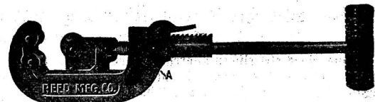
Fig. 2. Reed's Rohrschneider Quill Acting.

Figur 1 zeigt uns einen Reed'schen Rohr-Schraubstock mit auswechselbaren Stahlbacken von vorzüglichem Werkzeugstahl. Wenn die Backen stumpf werden, können sie durch Lösen der Schrauben sofort herausgenommen und auf der anderen Seite benutzt werden, was sogar viermal geschehen kann, bis es nötig ist, die Backen wieder zu schärfen. Diese Rohr-Schraubstöcke werden geliefert in diversen Größen und Dimensionen von der Firma Jakob, Wiederkehr & Cie., Winterthur.