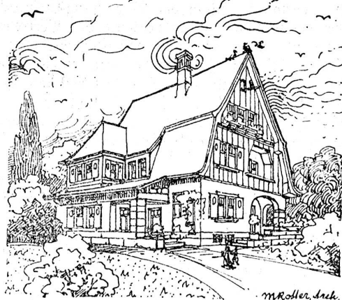
DAS KLEINE HAUS MIT 5 ZIMMERN ETC.