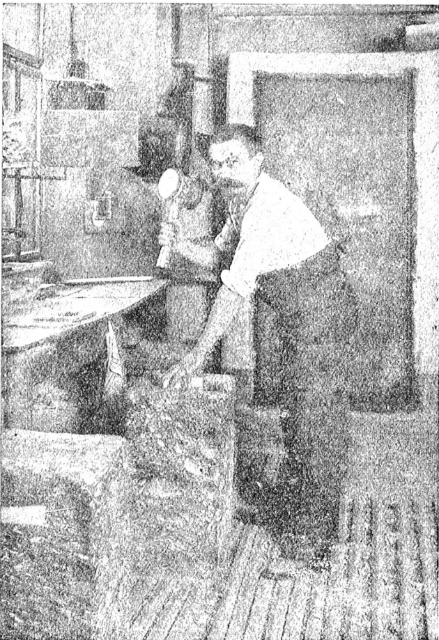
Abb. 8. Ein für die Schweiz arbeitender Staniol-Blattgoldschläger.

Zwecke nicht verwendet werden. Natürlich spricht bei der Haltbarkeit auch der Untergrund eine große Rolle; ebenso ist es begreiflich, daß kräftige Doppelgolde mehr Glanz ausströmen als einfache Golde, auch wenn sie punkto Feinheit gleichwertig sind. Wir haben seit Jahren in unsern Staniolgoldern, das heißt in Staniol verpackten Golden, etwas Spezielles für Maler und Vergolder geschaffen, und die teuerste Qualität, die wir hierin führen, kommt auf Fr. 90.— per 1000 Blatt = 9 Rappen pro Blatt.*) Das Verkaufen pro Buch ist viel weniger übersichtlich als unser auf 1000 Blatt gehende Preis. Natürlich werden auch für Spezialarbeiten noch weit stärkere Golde geliefert, Golde, die eben in der Dünnschlagform weniger lang behandelt werden und somit dicker bleiben. Bei der Berechnung von Vergoldarbeiten möge man als Basis nehmen, daß für den Quadratmeter Fläche zirka 200 Blatt benötigt sind.