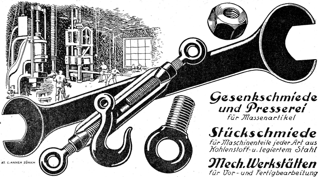
AT. C. ANNEN ZÜRICH

Gesenkschmiede und Presserei für Massenartikel