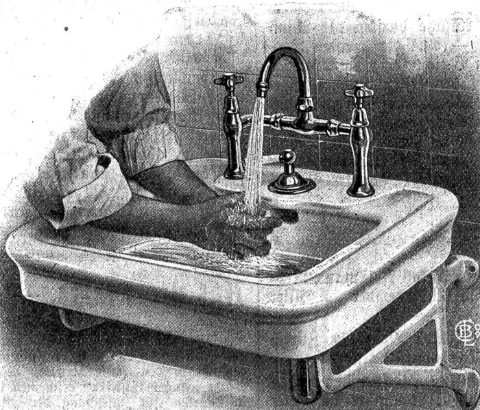
Abb. 7. Waschen in fließendem, temperiertem Wasser.

Eine befriedigende Lösung sei auch in der Frage der Unterbringung eines kleinen Bäckereibetriebes in der Gewerbeausstellung gefunden worden, während die Frage