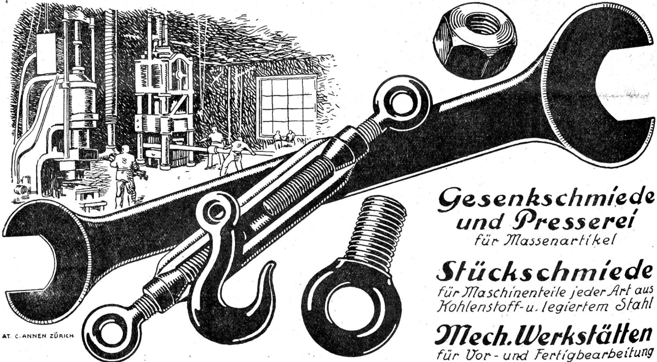
AT. C. ANNEN ZÜRICH

Gesenkschmiede und Presserei für Massenartikel