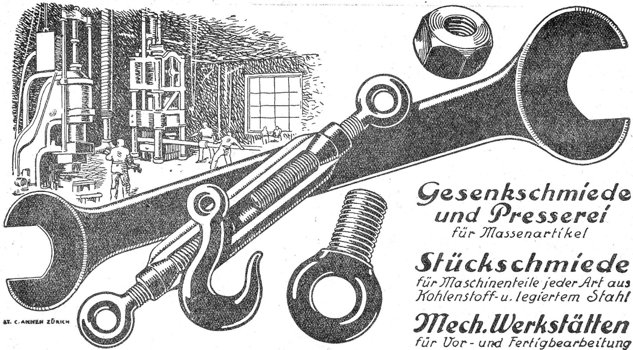
AT. C. ANHEN ZÜRICH

Gesenkschmiede und Presserei für Massenartikel