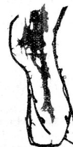
Abb. 16. Strangfasern.

Der Hausschwamm kann schon in Neubauten mit dem Bauholz, mit Auffüllungsmaterial usw. eingeschleppt werden. Das gleiche gilt für die Verwendung von Altmaterial, altem Holz und dergleichen. Damit sollte man sehr vorsichtig sein oder es noch