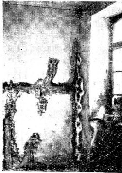
Abb. 30. Schüttsteinnische mit Fruchtkörperbildung.

usw. Auch kommt es vor, daß die Ansteckung verursacht wird vom Durchwachsen der Mycel-Stränge (Abb. 16) durch das Mauerwerk vom Nachbarhaus her. Die wichtigste Ansteckungsgefahr bedeuten aber Hausschwammherde mit reifen Fruchtkörpern (Abb. 30), die nicht beseitigt werden, durch die außerordentliche Sporenerzeugung und -verbreitung. Diese Keimen allerdings nur unter geeigneten Wachstumsver-