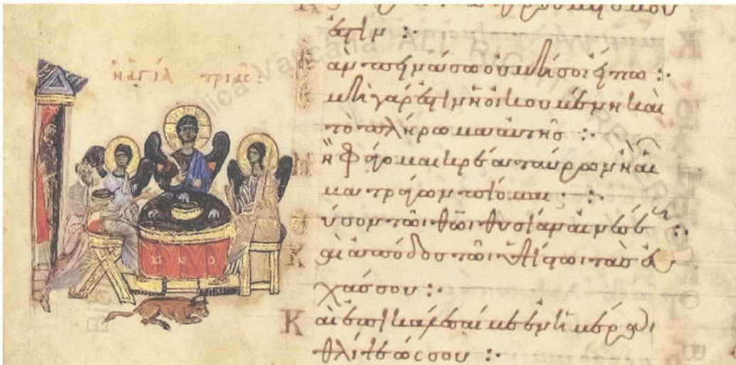
Abb. 7: Illumination einer griechischen Psalterhandschrift, Codex Vaticanus Barberinus graecus 372, fol. 85v, um 1092