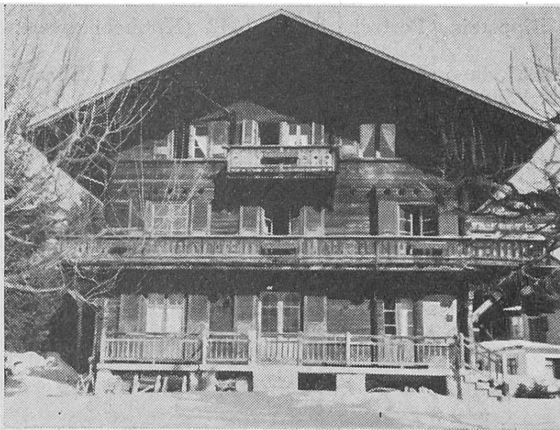
Villars sur Ollon Chalet St-Pierre mit Werktagkapelle