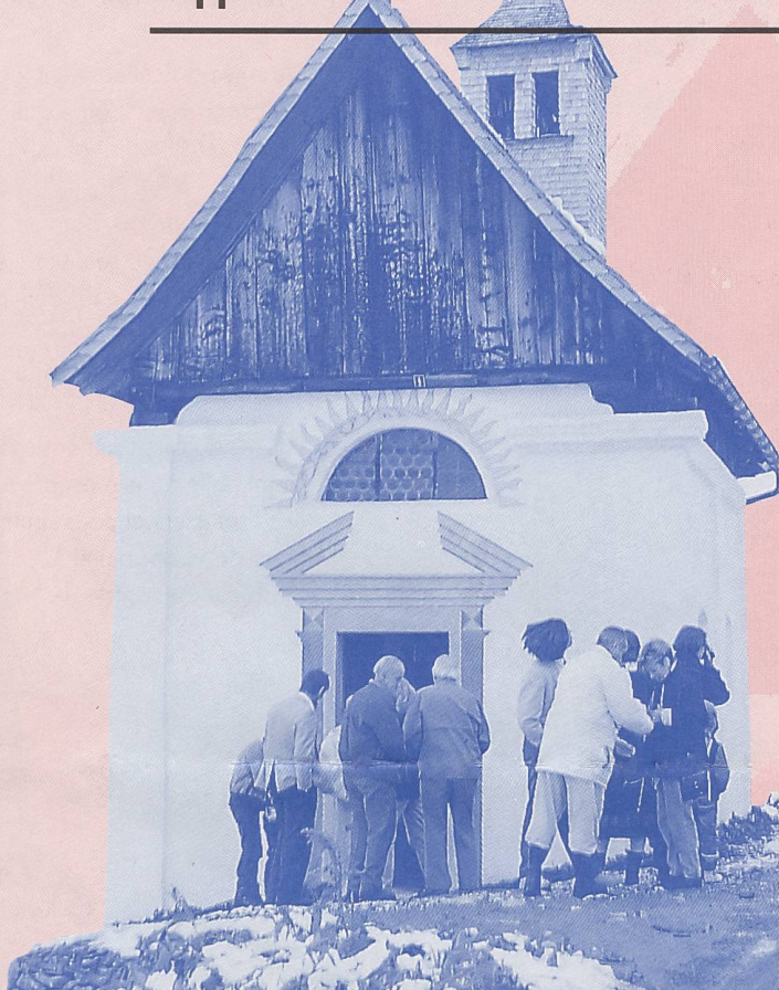
St. Anton, Travisasch