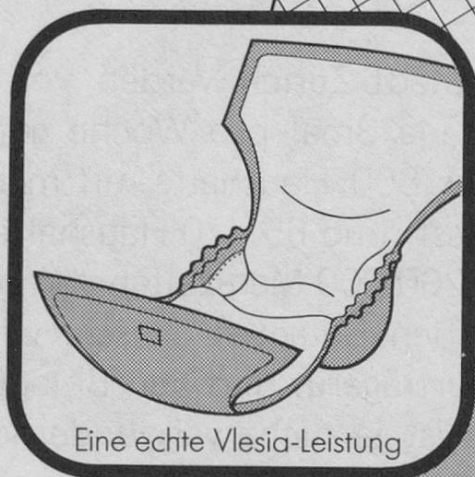
Eine echte Vlesia-Leistung

Rufen Sie bitte an und verlangen Sie Gratis-Muster.