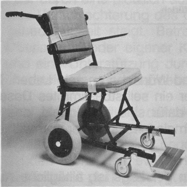
Transport- und Reisesstuhl