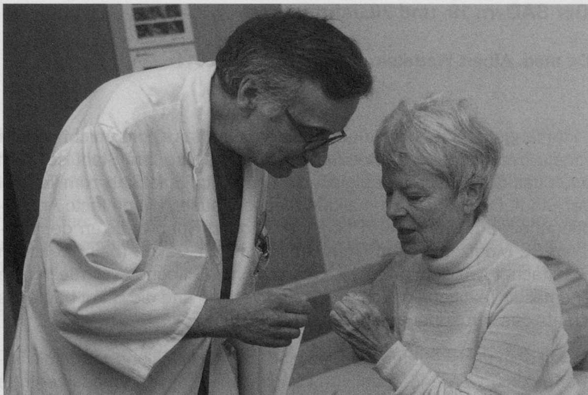
Abb. Stadtarzt bei seiner Tätigkeit im Pflegezentrum

einige eigene, moderne, Krankenhäuser genannte, Institutionen aufgebaut und im Betrieb: KH Rigipark (70 Betten seit 1943), KH Seeblick Stäfa (initial 22 Betten), KH Vogelsang (37 Betten ab 1957) und die modernen, noch heute als Pflegezentren betriebenen KH Bachwiesen (112 Betten ab 1961), KH Käferberg (210 Betten in Etappen ab 1963) und Bombach (130 Betten in Etappen ab 1965).