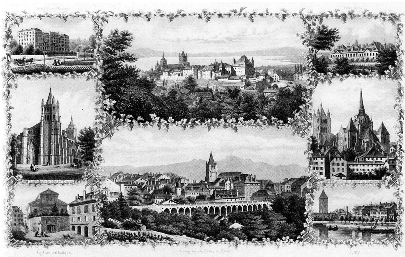
Fig. 283 Souvenir de Lausanne , édition Chr. Krüsi, Bâle. Lithographie vers 1860–1870.