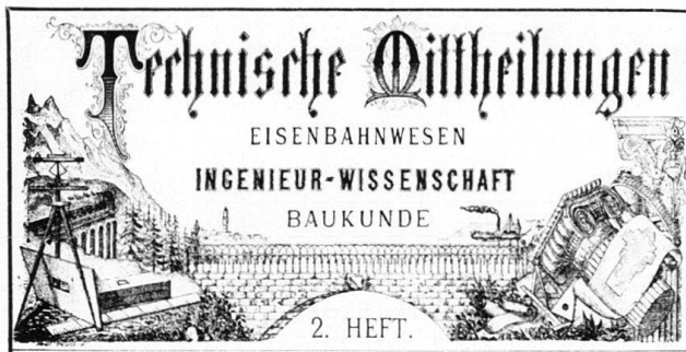
Abb. 4 TM. Kopf des Titelblattes, 1876 bis um 1910.

Schweiz im Bild 1974 = Schweiz im Bild – Bild der Schweiz? Landschaften von 1800 bis heute . Katalog der Ausstellung in Aarau, Lausanne, Lugano und Zürich, 1974, bearbeitet im Kunstgeschichtlichen Seminar der Universität Zürich, Zürich 1974.