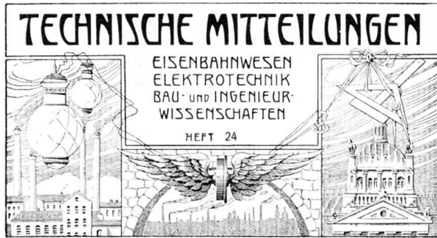
Abb. 5 TM. Kopf des Titelblattes, verwendet um 1910 bis 1920.

Statistique Usines hydrauliques 1928 = Statistique des Usines hydrauliques de la Suisse au 1er janvier 1928 . Publiée par le Service fédéral des Eaux, Berne 1928.