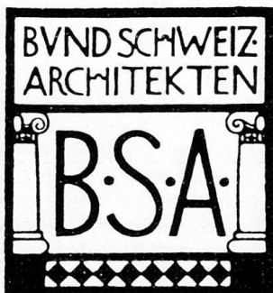
Abb.1 Signet der 1908 gegründeten Architekten-Vereinigung BSA vom Titelblatt des Vereinsorgans Die Schweizerische Baukunst , Jahrgang 1, 1909.