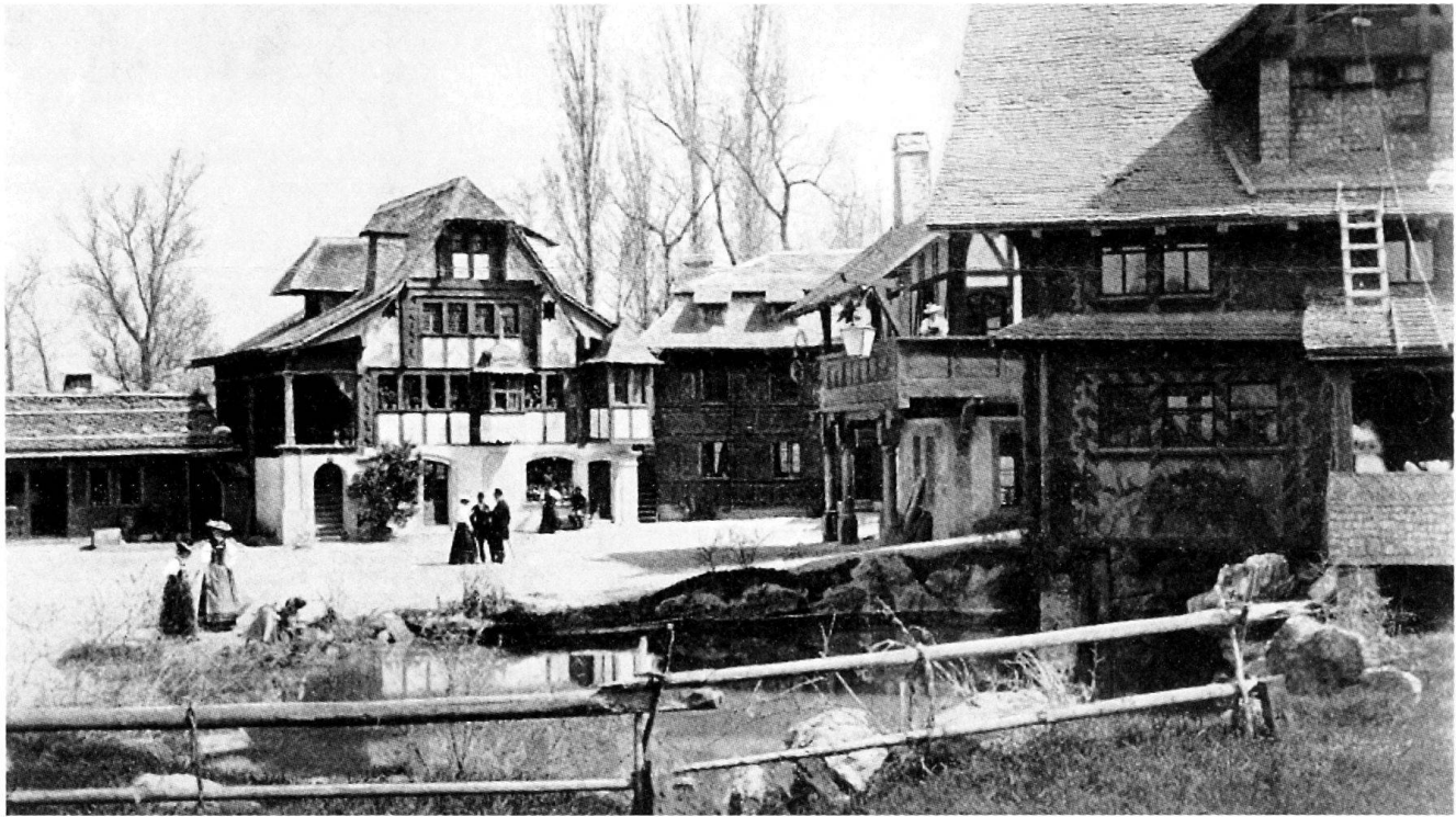
Abb.100 Stanser Haus auf dem Dorfplatz im Schweizer Dorf der Landessaussstellung von 1896 in Genf. Es handelt sich um einen verkleinerten Nachbau des Hauses an der Nägelligasse 23 vor dessen Umgestaltung durch Kunstmaler Heinrich Keyser von 1848–1849. Aus: Album du Village Suisse. Exposition Nationale Suisse , Genf 1896.

Felix 1865, Winkelried = Heinrich Felix, Winkelried oder Festbüchlein zum Andenken an die Einweihung des Winkelried-Denkmal in Stans , Luzern 1865.