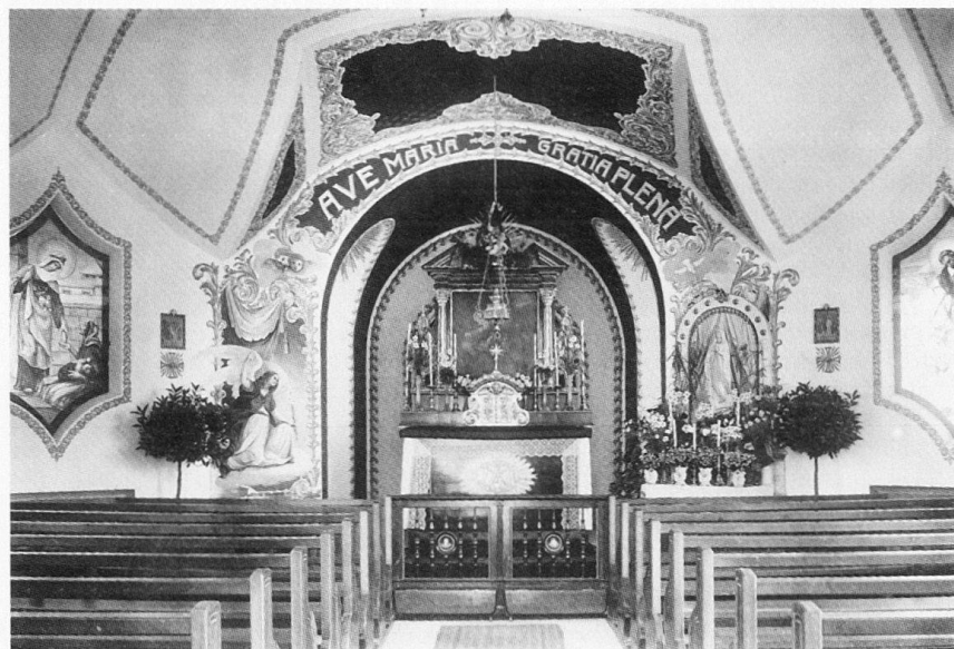
Abb. 99: Mettenwegkapelle (bei Buochserstrasse 45). Innenaufnahme, wohl kurz nach Fertigstellung 1913.

Felix 1865, Freischiessen = Heinrich Felix, Festbüchlein auf das eidgenössische Freischiessen in Stans pro 1861 , Luzern 1861.