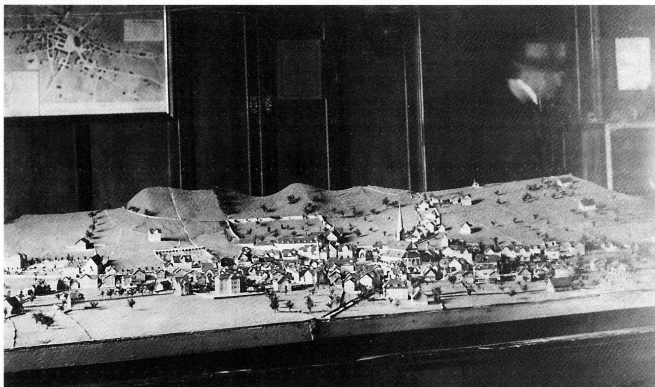
Abb. 101 Dorfmodell Stans. Zwischen 1885 und 1891 beschäftigt sich Coiffeur Jakob Christen mit dem Erstellen eines Dorfplanes im Massstab 1:1000 und eines Dorfmodelles im Massstab 1:500. Die Fotografie um 1891 zeigt das Modell und den Plan vor der Aufstellung im Historischen Museum im alten Salzmagazin ( Stansstaderstrasse 23).