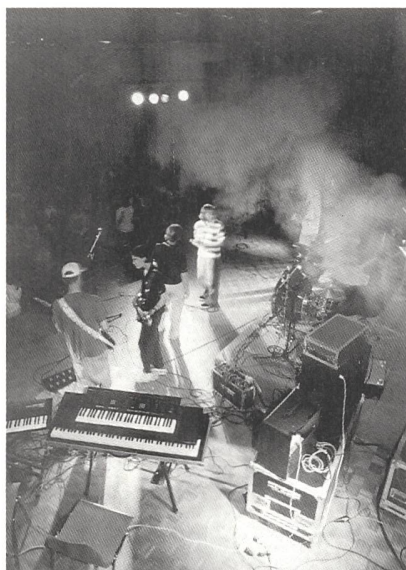
Profi-Ambience für junge Amateure: Das Band it-Openair sorgt für gute Stimmung auf dem Zürcher Platzspitz.

Bis zum 27. Juni noch ist an den regionalen Band it-Anlässen zu hören, wie Brit-Pop aus Bauma, Grunge aus dem Säuliamt oder Trip-Hop aus Opfikon klingt. Krönender Abschluss des Festivals ist das grosse Openair auf dem Zürcher Platzspitz. Am Samstag, 11. Juli steigen dann sieben von der Fachjury ausge-