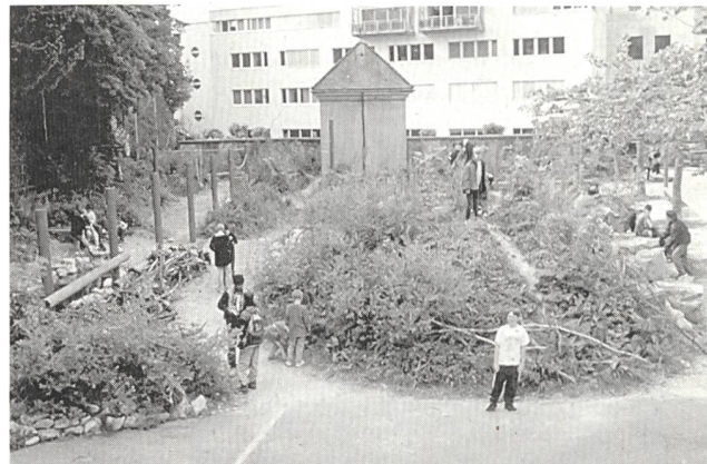
Pausenplatz Hermesbühschulhaus Solothurn, vor und nach der Umgestaltung. Foto Alex Oberholzer 1 .

me (OECD, EU, UNESCO, usw.) für die Schulen propagieren, bleibt der Einfluss solcher Verpflichtungen und Angebote auf unsere Schulen und Bildungspolitik marginal. Das hängt einerseits mit der Kantonshoheit im Schulwesen und dem traditionellen «Anti-Bundes-Reflex» der EDK zusammen, andererseits zeigt das BAG-EDK-Rahmenprogramm «Schulen und Gesundheit» (vgl. Themenschwerpunkt), dass mit einer starken Lobby und geschicktem Vorgehen geeignete Kooperationsformen gefunden werden können.