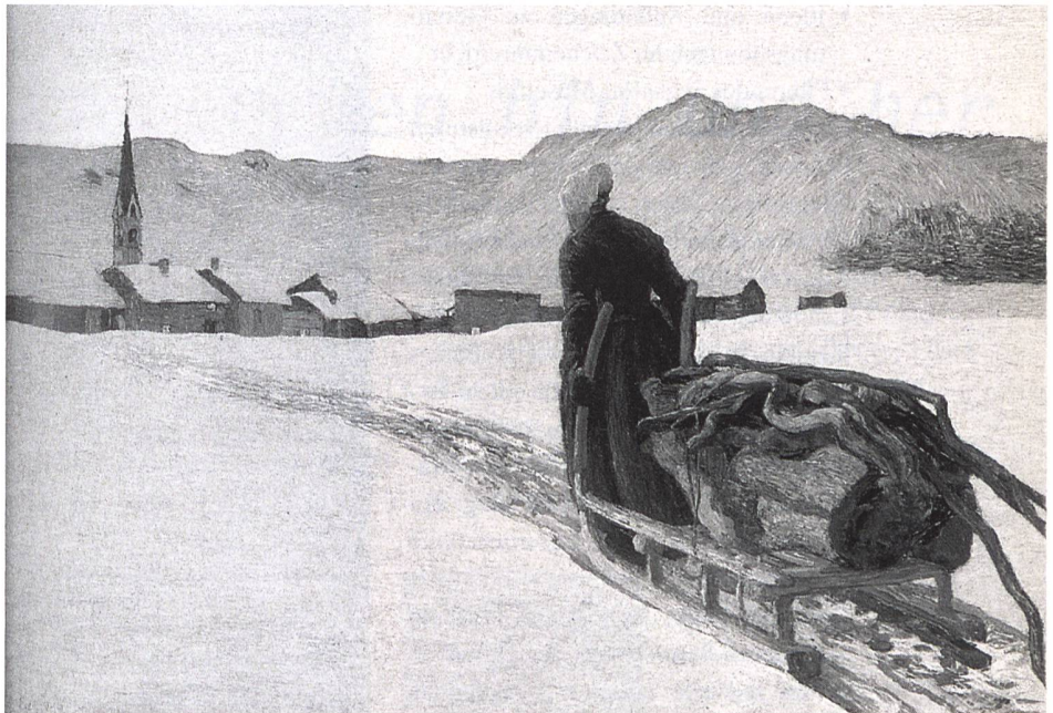
Ritorno dal bosco (Rückkehr vom Wald), 1890. Öl auf Leinwand, 64x95 cm. Otto Fischbacher-Giovanni Segantini Stiftung, St. Gallen, Dauerleihgabe im Kunstmuseum St. Gallen