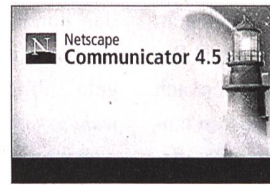
Navigation im Internet: Die Bildsprache der Browser-Flotte

in einer digitalen Sphäre aufzulösen und verweisen zunehmend auf virtuelle Gegebenheiten. Das Menü ist nicht mehr nur für die Speisenfolge einer Mahlzeit vorbehalten. Der Speicher , wo man die Getreidevorräte aufzubewahren pflegte, hat sich zum Gedächtnis einer elektronischen Maschine gewandelt. Das Fenster gibt nicht mehr den Blick in die Natur frei, sondern dient als begriffliche Metapher für den grafischen Rahmen eines Computerprogramms. Das Öffnen und Schliessen auf dem Bildschirm geht denn auch ohne Luftzug und mit lautlosem Klick vonstatten. Selbst das Konvertieren wird inzwischen von weltlicher Software besorgt und setzt keinen tief greifenden Gesinnungswandel mehr voraus.