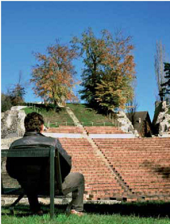
Abb. 10: Augst, Theatersanierung (Grabung 2006.055). Herbststimmung im Römischen Theater.