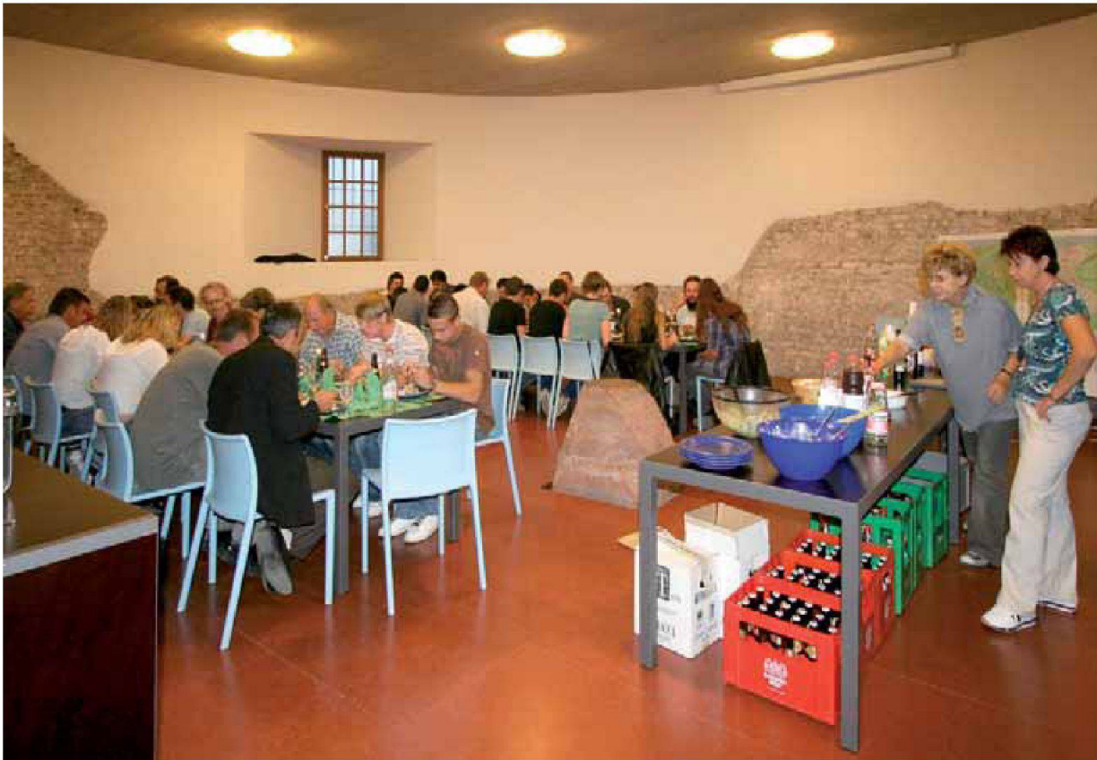
Abb. 2: Augst, Theatersanierung (Grabung 2006.055). Gute Stimmung herrschte im Curiakeller beim abschliessenden Essen mit den an der Theatersanierung beteiligten Handwerkern.

gen Süden konnte zudem eine wesentliche Entlastung der nördlichen Mauerschale der Aditusmauer MR 7 erreicht werden. Weiche Neoprenunterlagen verhindern punktuelle Druckstellen und sorgen für eine möglichst ganzflächige Verteilung der Last. Da der Brückenkörper nur an der Kioskplattform verankert wurde, konnte eine Verletzung der über dem antiken Mauerkörper aufgetragenen und mit der ruinenhaft erscheinenden modernen «Verschleisschicht» überdeckten wasserdichten Schutzschicht 4 vermieden werden.