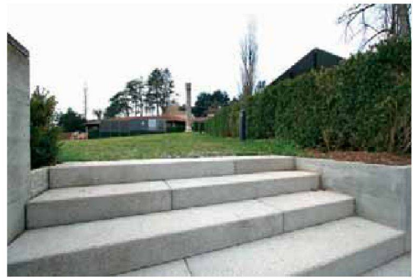
Abb. 4: Augst, Theatersanierung (Grabung 2006.055). Der neu gestaltete Versammlungsplatz im nordwestlichen Theater-Vorfeld.

Parallel zur Anlage der Schotterrasenwege wurde die Elektrifizierung des gesamten Monumentes abgeschlossen.