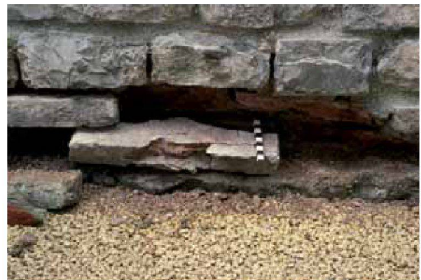
Abb. 15: Augst, Theatersanierung (Grabung 2006.055). Südwanne des Südost-Vomitoriums; die zusammengeklebte Ziegelplatte wird an ihrem ursprünglichen Ort wieder in den Mauerbefund eingefügt.

Ebenfalls beendet werden konnte die Sanierung des Südost-Vomitoriums. Währenddem sich das Steinmaterial der mit Kalksteinhandquäderchen aufgeführten Mauerpartien der südlichen Vomitoriumswange noch in relativ gutem Zustand befand, hatten hier vor allem die im Mauerwerk eingelegten antiken Ziegelbänder stark unter der allzu harten Zementverfugung aus den 1940er Jahren gelitten. Bis in eine Tiefe von ca. 15 cm, gemessen ab der Mauerschale, zeigten die Ziegelplatten deutliche Frostspaltungen. In langwieriger Kleinarbeit gelang es dem bewährten Team der Theaterbauhütte, die originalen Ziegel wieder zusammenzukleben, so dass nur in wenigen Fällen ein Ersatz des Frontstückes durch eine vorgeblendete Ziegelscheibe 21 unumgänglich wurde (Abb. 15).