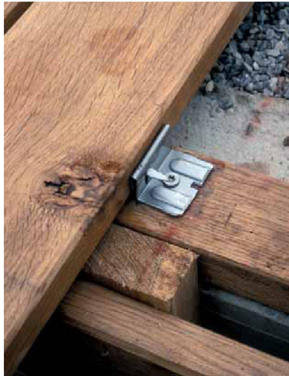
Abb. 9: Augst, Theatersanierung (Grabung 2006.055). Einbau des Bühnenbodens aus Eichenbrettern: Die Domen des Montagesystems «Igel» werden seitlich in das nachfolgende Bodenbrett gedrückt, dadurch dringt weniger Regenwasser in die Hölzer ein und die Lebensdauer des Bodens wird verlängert.