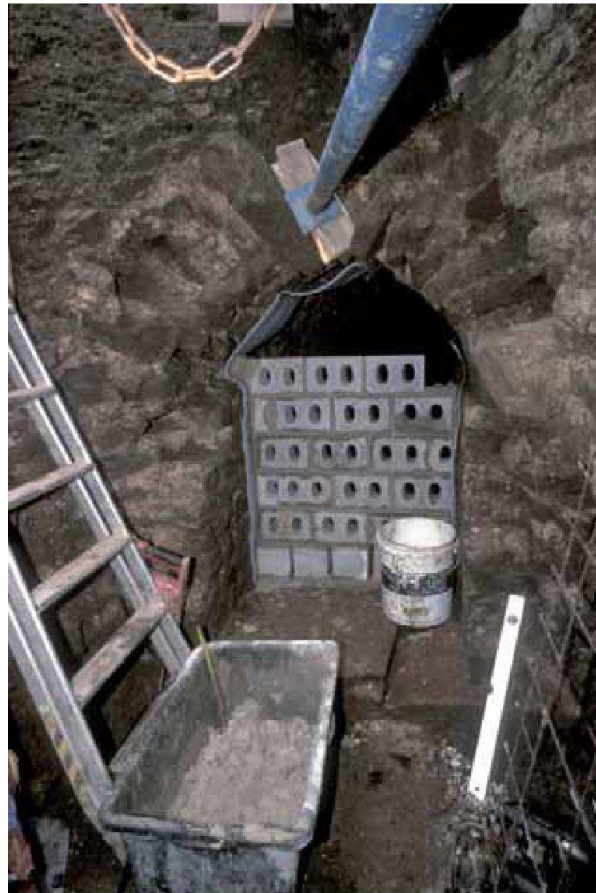
Abb. 13: Augst, Theatersanierung (Grabung 2006.055). Das Westende des durch die Theaterparzelle führenden Abwasserkanals wird mit einer Mauer-scheibe aus modernen Kalksandsteinen verschlossen. Im Bild deutlich sicht-bar die überwölbte Kanalkonstruktion.

terakrobatik im Gewirr der eingespannten Sprössen nötigte (Abb. 12), musste das freigelegte Westende des durch die Theaterparzelle führenden antiken Abwasserkanals verschlossen werden. Um den Ablauf von allfälligem, bei hohem Wasseraufkommen durch den Kanal abfließendem Wasser nicht zu behindern, wurde eine Mauer-scheibe aus modernen Kalksandsteinen so in den Kanal gestellt, dass das Wasser durch die in Fließrichtung offenen Löcher in den verbauten Kalksandsteinen ablaufen kann. Um ein Wegrutschen der Abmauerung zu verhindern, wurde die Mauer durch je zwei in die Fugen der beiden Kanalwangen eingebohrte Glasfaserdübel verankert. Zwischen dem antiken Kanalmauerwerk und der modernen Abmauerung wurde eine isolierende Schaumstoffschicht eingelegt. Die Sondierung wurde im Anschluss mit Wandkies verfüllt (Abb. 13).