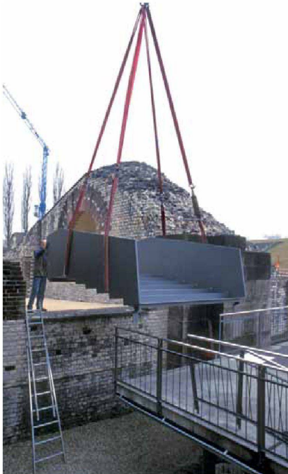
Abb. 3: Augst, Theatersanierung (Grabung 2006.055). Eine Brückenkonstruktion aus Stahl wird mit dem Pneukran an ihren Platz zwischen Kioskplattform und Nordaditus gebracht, so dass in Zukunft die Besucherinnen und Besucher entlang der antiken Zugangsachsen in die Orchestra gelangen können.

lände rückzubauen, konnte damit umgesetzt werden. Als zeitraubend erwies sich die Entfernung möglichst vieler Ableger aus dem Wurzelstock einer im Jahre 1999 beim Sturm «Lothar» im nordwestlichen Vorfeld gefällten Robinie; eine dringend notwendige Arbeit, um zu vermeiden, dass die bereits jetzt in erheblicher Zahl aufgetretenen Wurzelschösslinge in kurzer Zeit zu Unterhaltsproblemen führen.