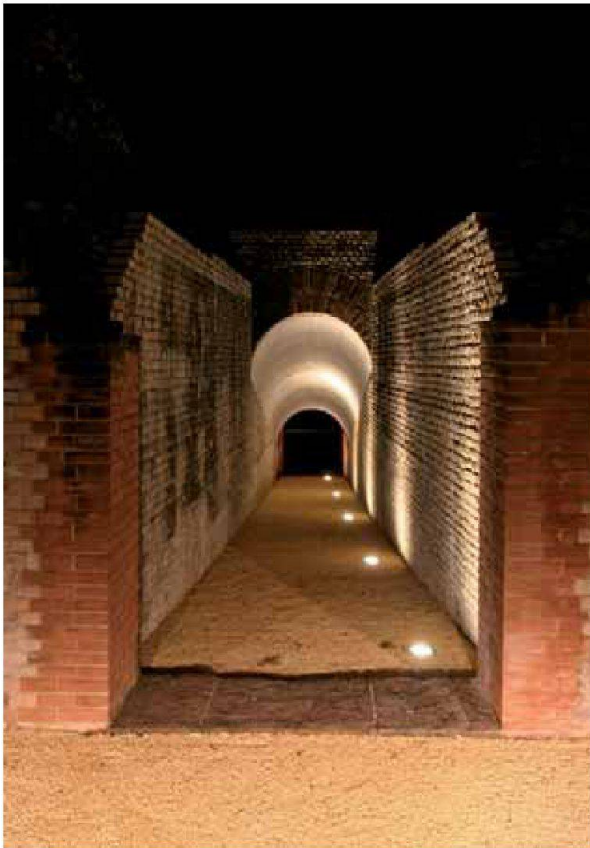
Abb. 5: Augst, Theatersanierung (Grabung 2006.055). Monumentenbeleuchtung. Blick von der Peripherie durch das so genannte Südost-Vomitorium.

Einbau des Bühnenbodens beauftragte Holzbaufirma K. Graf, Maisprach 7 , empfohlen wurde, mussten auf der Oberfläche der Bühne kaum Schrauben verwendet werden. Es entstand so einerseits eine optisch sehr ruhig erscheinende Bodenfläche, andererseits sorgt das Montagesystem auch für eine verbesserte Haltbarkeit der Eichenbretter. Weil die Dornen der Befestigung seitlich in die Bretter hineingedrückt werden, dringt weniger Regenwasser in die Hölzer ein und die Lebensdauer des Bodenbelags wird deutlich verlängert (Abb. 8; 9).