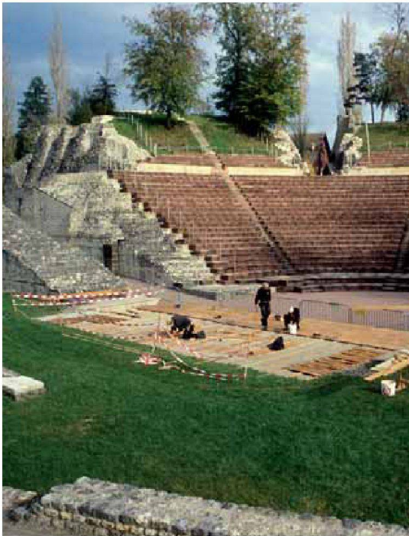
Abb. 8: Augst, Theatersanierung (Grabung 2006.055). Einbau des Bühnenbodens aus Eichenbrettern durch Mitarbeiter der Holzbaufirma K. Graf, Mairsprach.