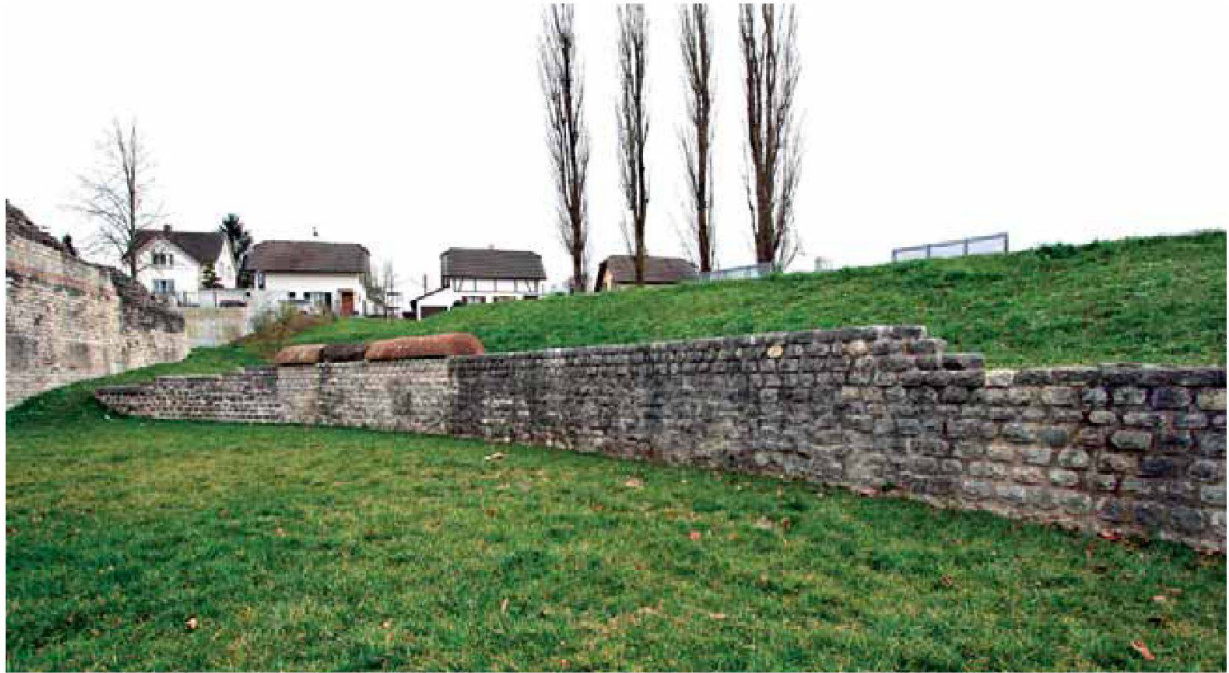
Abb. 14: Augst, Theatersanierung (Grabung 2006.055). Südwestliche Podiumsmauer des Amphitheaters, Übersicht über die fertig sanierte Mauerpartie.

denen Hohlräume wurde eine fein geschlämte Kalkemulsion 20 eingebracht und die antiken Verputzkanten wurden anschliessend mit Restauriermörtel angebördelt. Das optische Erscheinungsbild der Podiumsmauer wird durch diese Sicherungsmassnahmen kaum beeinflusst. Die Feinsanierung dieser wichtigen Mauerpartie ist damit abgeschlossen (Abb. 14).