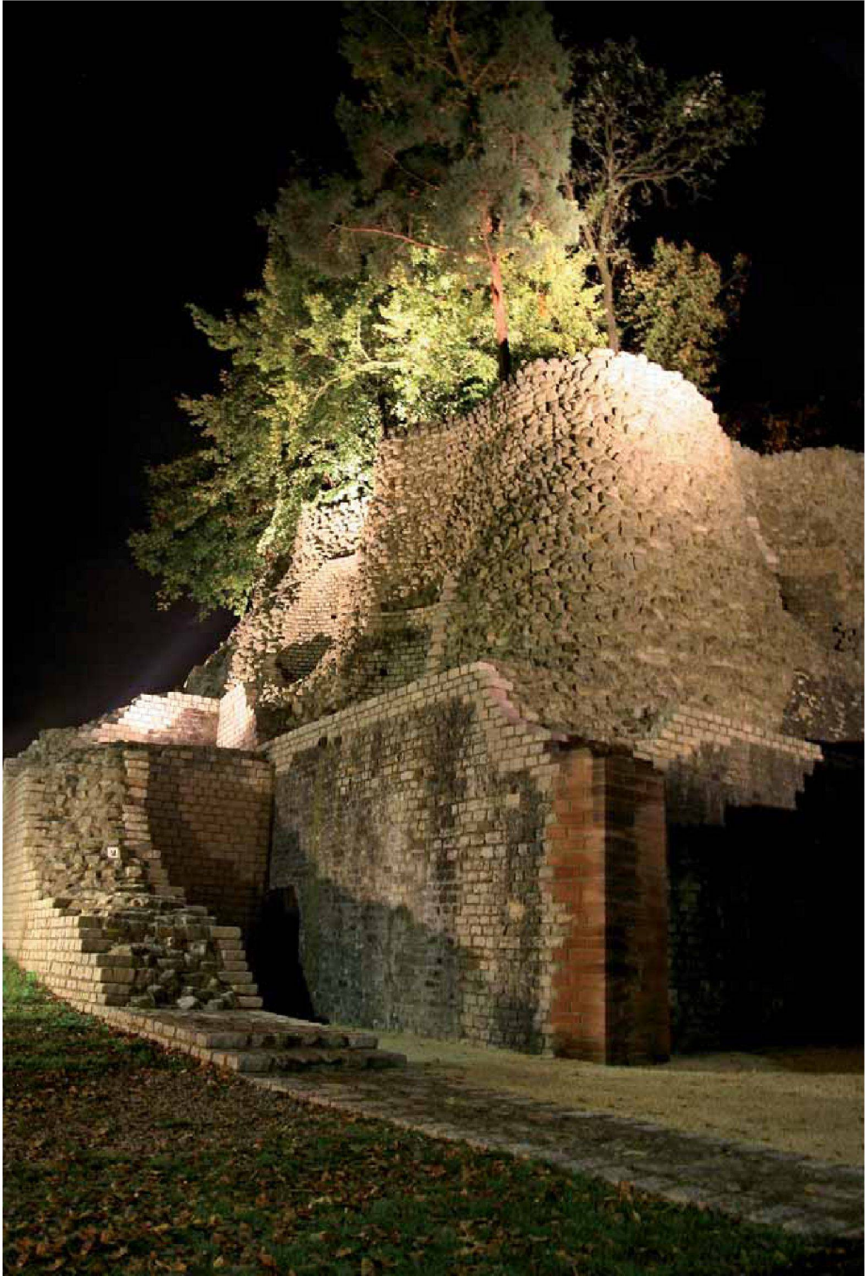
Abb. 7: Augst, Theatersanierung (Grabung 2006.055). Monumentenbeleuchtung, Eingang zum Mittelvomitorium. Von unsichtbaren Scheinwerfern angestrahlt, recken sich Mauerwerk und Baumbestand effektiv zum Himmel.