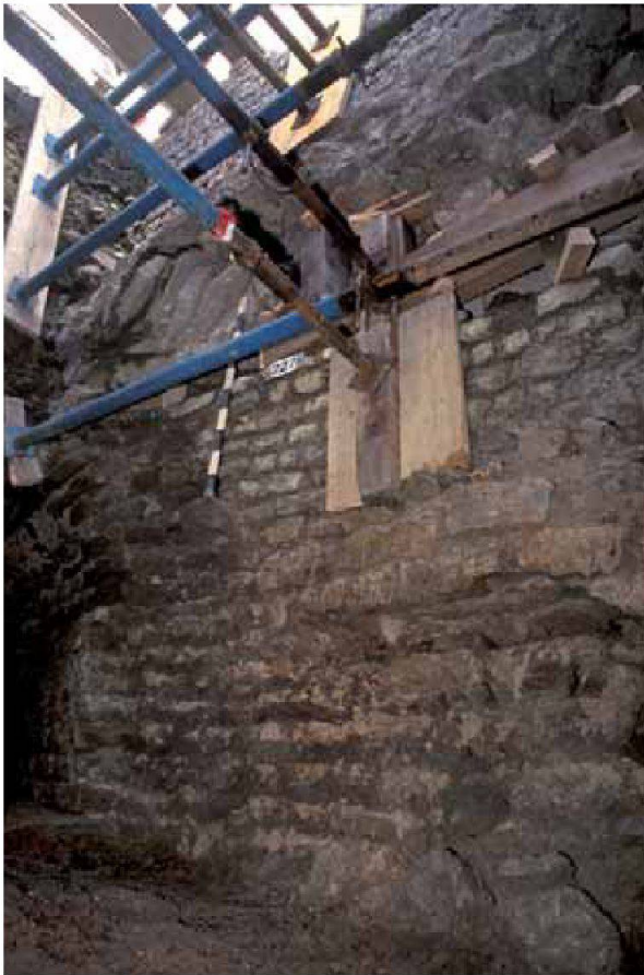
Abb. 12: Augst, Theatersanierung (Grabung 2006.055). Sondierung Feld 250/251; eine komplizierte Sprössung ermöglicht das detaillierte Studium der komplexen mehrphasigen Mauerbefunde.