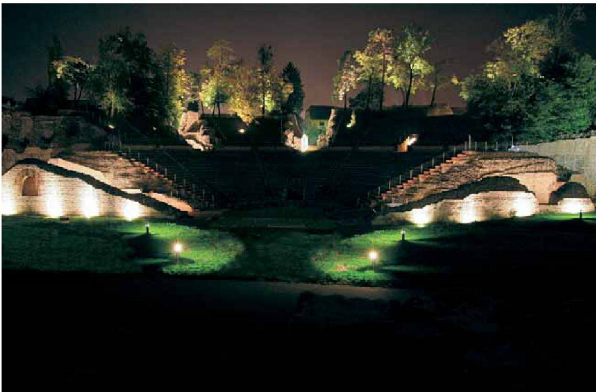
Abb. 6: Augst, Theatersanierung (Grabung 2006.055). Monumentenbeleuchtung. Vom Schönbühltempel aus gesehen bietet das beleuchtete Theater einen imposanten Anblick.