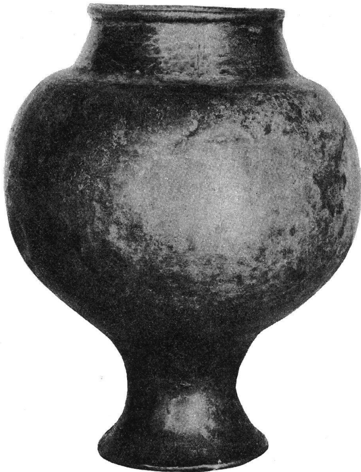
Abb. 24. Bronzeurne vom Turbenmoos bei Gümligen. Etwa 5 : 8. Museum Bern.