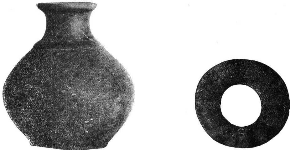
Abb. 22. Fundstücke vom Rossfeld bei Bern (Museum Bern). ca. 1 : 2. etwas unter nat. Gr.

Tschumi berichtet uns ferner, dass die Nekropole vom Rossfeld bei B. 1) noch nicht erschöpft ist, indem bei Grabungen für eine Wasserleitung neuerdings mehrere Gräber, 5 Skelett- und 2 Brandgräber angeschnitten wurden. In einem der Skelettgräber fand sich eine gelb-