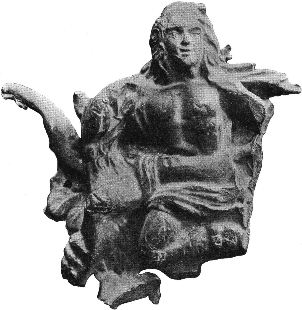
Abb. 26. Applique in Blei, den Raub des Ganymed darstellend, aus dem Oberwallis.

entführt wird. Der Fundort kann nicht genau bestimmt werden. Ein (seither verstorbener) Arbeiter, der in Visp arbeitete, aber in Grosseyen bei Raron wohnte, brachte die durch Kalksinter und Erde fast unkenntliche Figur (Abb. 26) eines Abends (im J. 1910, 11 oder 12?) nach Hause, mit dem Bemerkten, er habe sie auf dem Wege gefunden. Nach dem