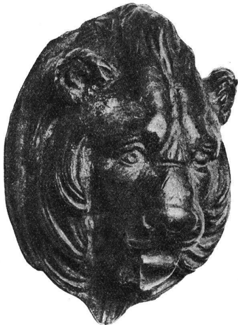
Abb. 25. Applique aus Bronze, Löwenkopf von Thielle.

Nach einer nichtssagenden Notiz in N. Z. Z. vom 8. Juni 1913 wurden „zwischen Mendrisio und Capolago“ verschiedene römische Grabstätten aufgedeckt. „Sie enthielten Tonsachen und Fibeln.“