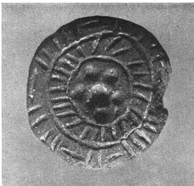
Abb. 15. Ornamentierter Tondiskus von der Stiegenloshöhle (Rüttenen, Soloth.). (Etwas über nat. Gr.)