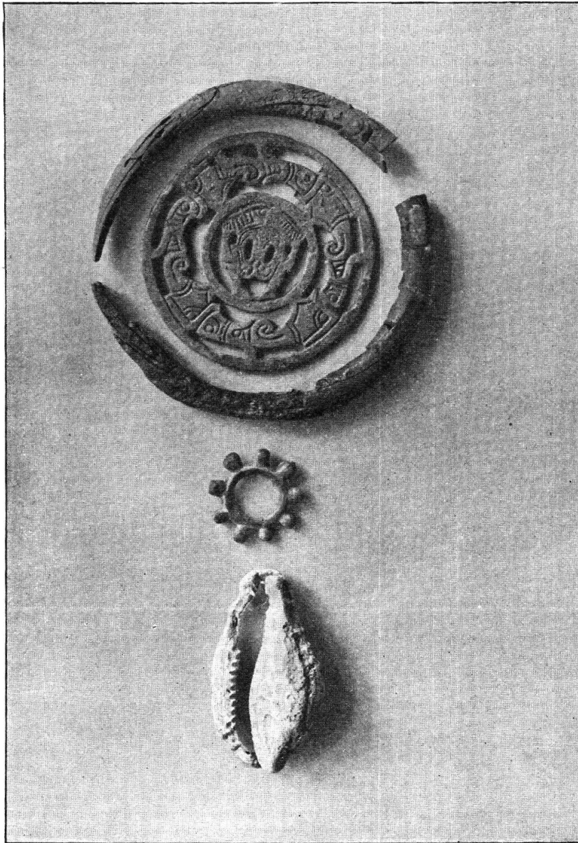
Abb. 21. Löhningen. Gräberfeld im Dorf. Zierplatte (äusserer Ring Elfenbein) und Anhänger.

und Perlstäben. Unterhalb der Kniee lag je eine Schnalle mit Zierplatte aus Eisen, offenbar der Verschluss des Leibgurtes. An diesem Gürtelende eine durchbrochene Bronzescheibe (Abb. 21), umfasst von einem Gagatring mit Bronzeblechbeschlägen als Rahmen; sie zeigt als Schmuck eine gravierte, stilisierte hockende Menschenfigur mit erhobenen Armen;