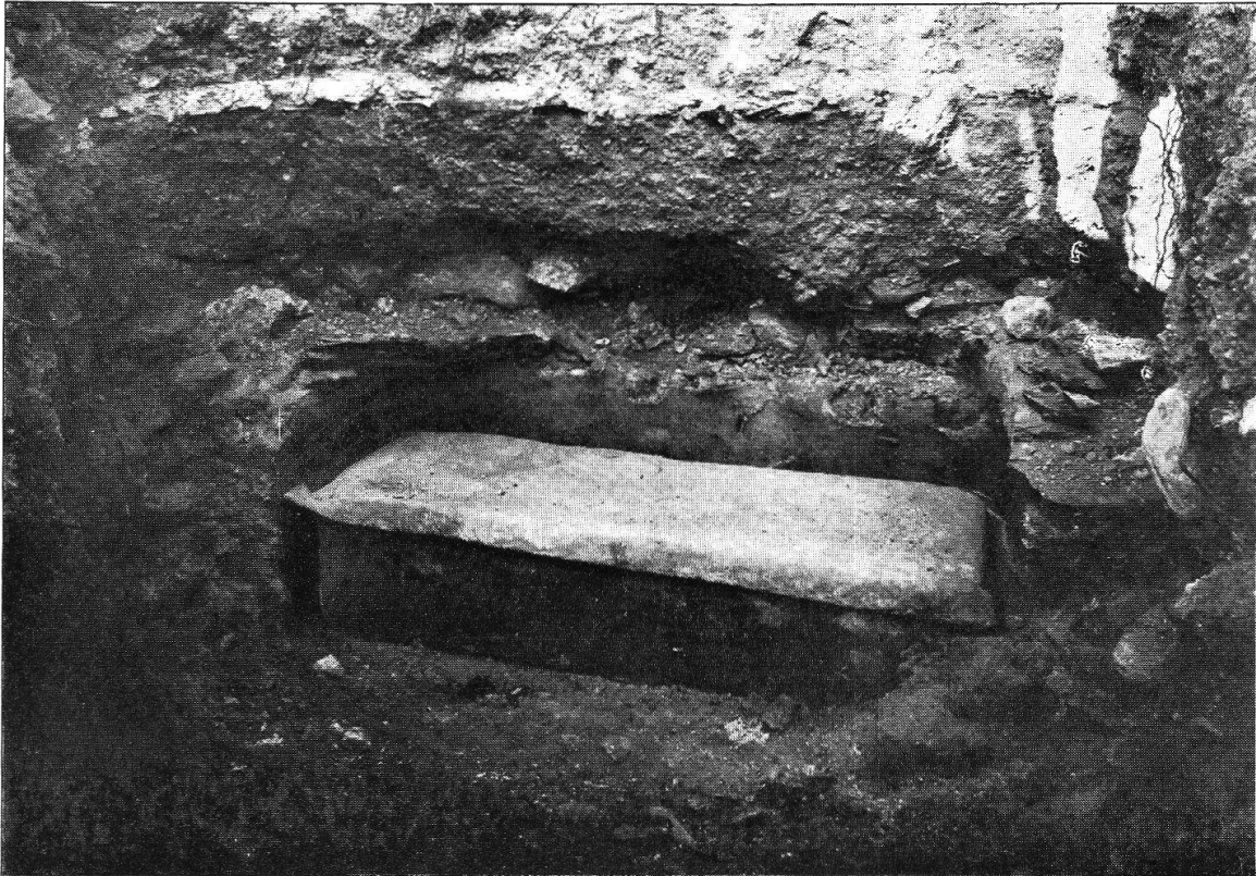
Conthey-Plan. Spätromischer oder frühmittelalterlicher Sarkophag. (S. 97.)