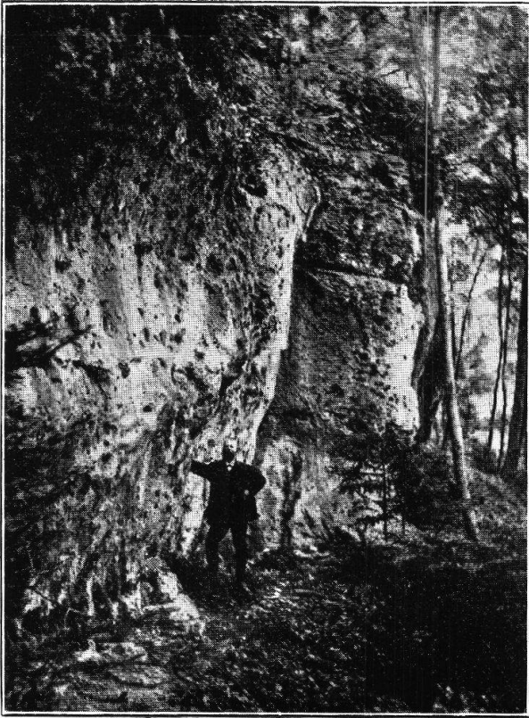
Tafel III, 1. Zeiningen. Bönistein. S. 29.