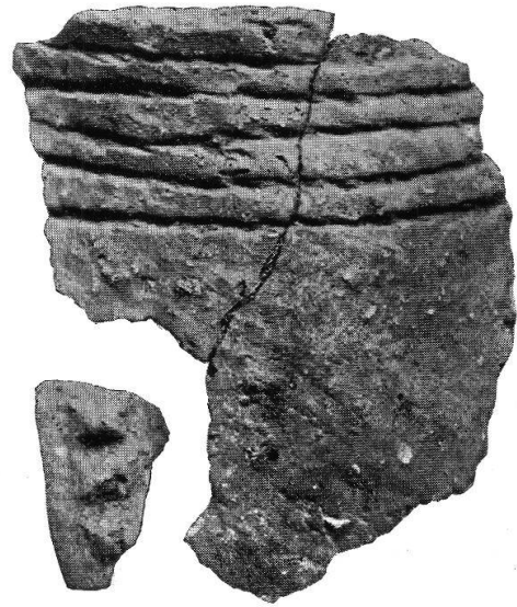
Tafel III, 2. Sarmenstorf. Zigiholz. Schnurkeramische Scherbe. S. 46.