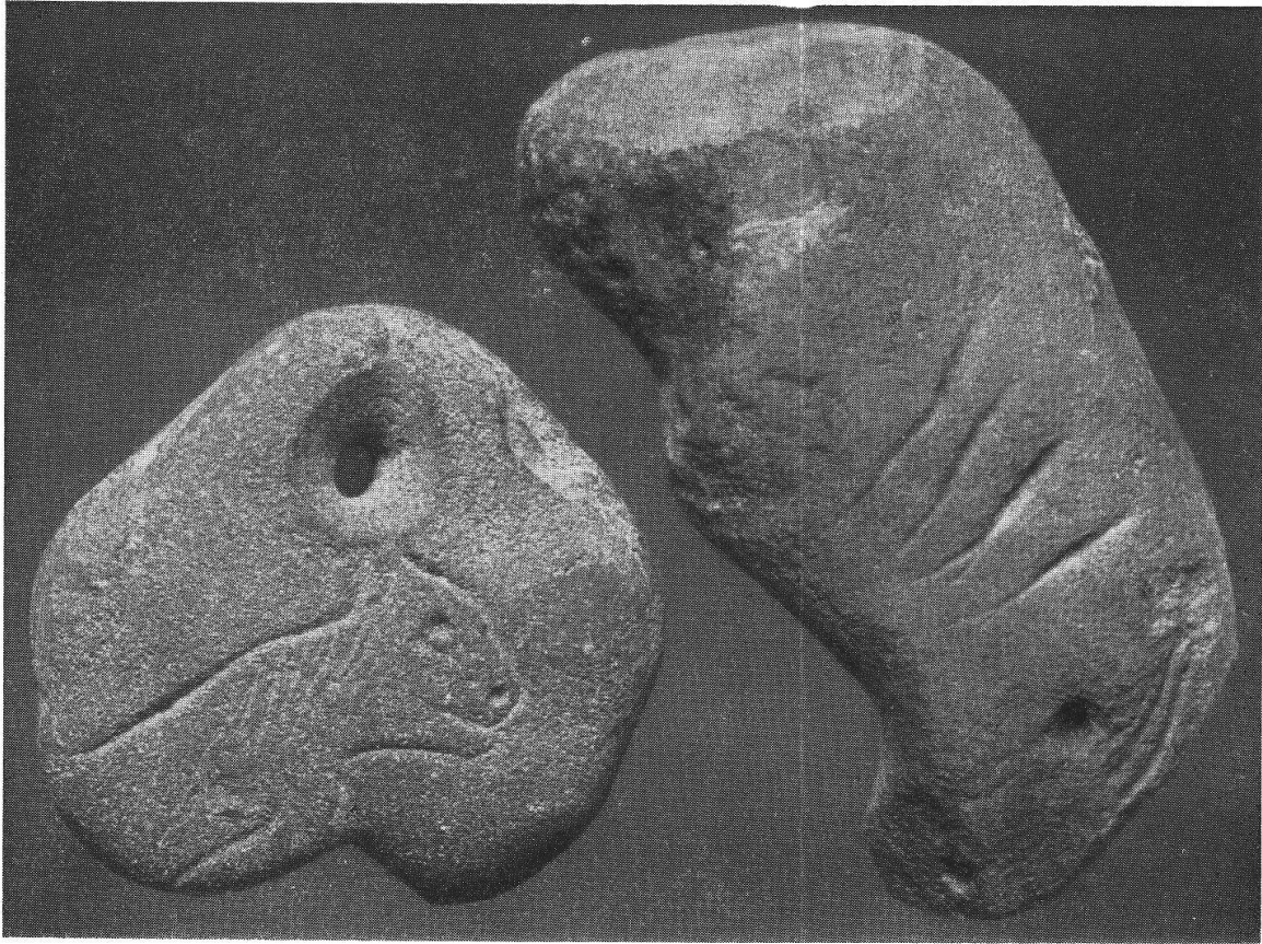
Tafel IV, 1. Baar. Baarburg. Felide und Auerochs. S. 73. (Aufnahme des Verfassers).