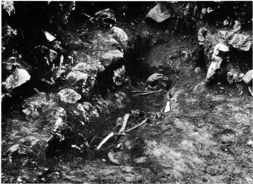
Planche VIII, fig. 1. Tombe Bronze II de La Baraque, Cressier (p. 67)