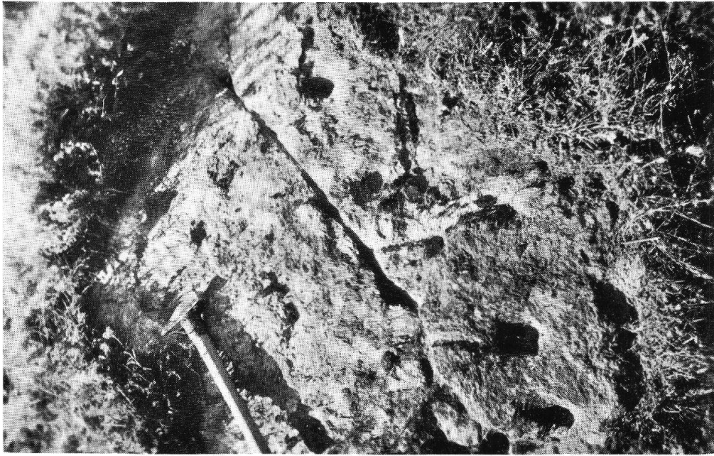
Planche XI, fig. 2. Chalais-Alpe Trucui Pierre à cupules (p. 98)