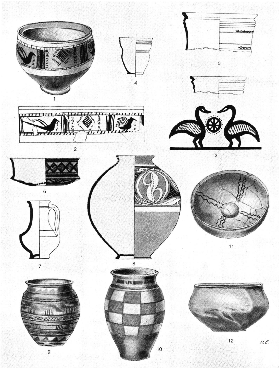
Taf. XXXV. Bemalte und unbemalte Latène-III-Gefäße aus schweizerischen und deutschen Fundstellen. 1, 2 Genf - Les Tranchées, bemalter Becher mit seltenem Vogelfries und dessen Abrollung, nach Cartier; 3 hallstädtische Vogeldarstellung auf einer geometrischen Vase Griechenlands, nach Roes; 4, 5 Augst, unbemalter Gurtbecher, nach Ettlinger; 6—8 Basel-Gasfabrik, bemalte Schale, unbemalter Henkelkrug, bemaltes Kugelgefäß, nach Major; 9 Mölsheim, bemaltes Prunkgefäß mit gezählter Doppelleiste, nach Behrens; 10 Osthofen, bemalte Urne, nach Behrens; 11, 12 Nauheim, Omphalosschale, Schüssel, unbemalt, nach Quilling. (S. 257—270)