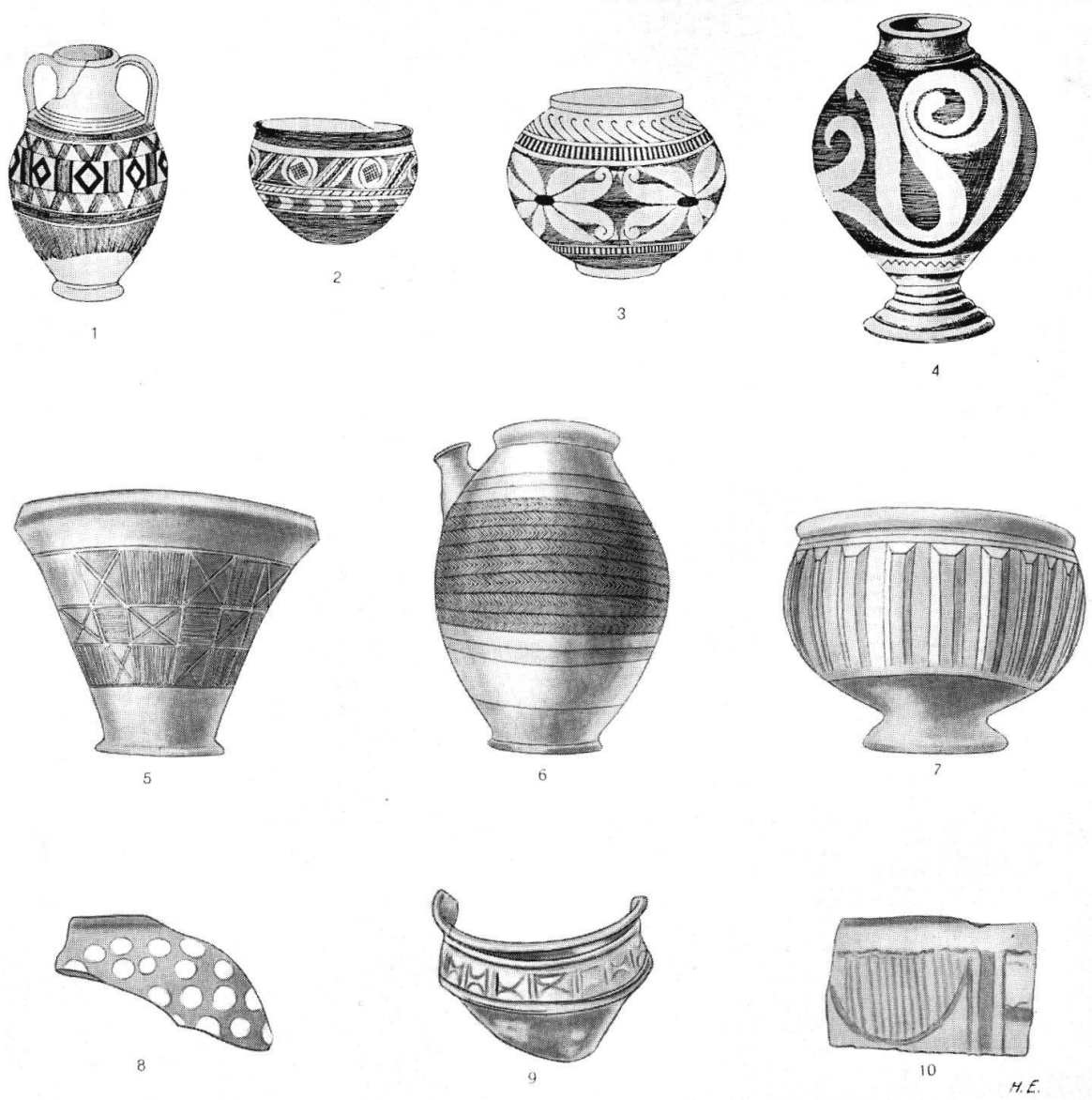
Taf. XXXVI. Bemalte und unbemalte Latène-III-Gefäße aus französischen und böhmischen Fundstellen. 1. Montans (Tarn), bemalter Henkelkrug; 2, 3 Roanne (Loire), bemalte Schüsseln; 4 Prunay (Marne), bemalte Urne, alle nach Déchelette; 5—7 Mont-Beuvray (Saône-et-Loire), bemalter Becher, Vorratsgefäß mit Ausguß, Fußschale, nach F. und N. Thiollier; 8—10 Stradonitz, bemalte Gefäßscherben, nach Pič. (S. 257—270)