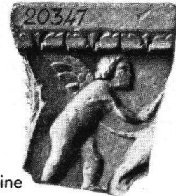
Taf. XXIV, Abb. 1—5 (S. 306—310)