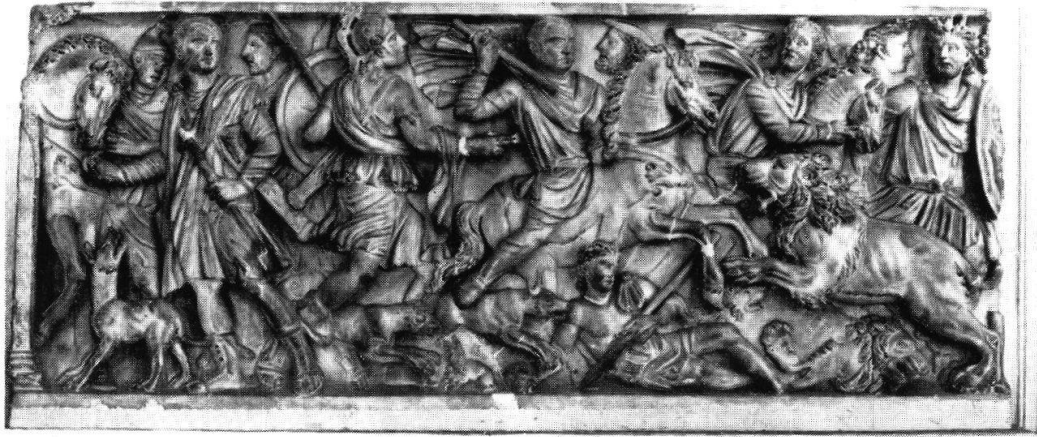
Abb.1 Sarkophag mit Löwenjagd