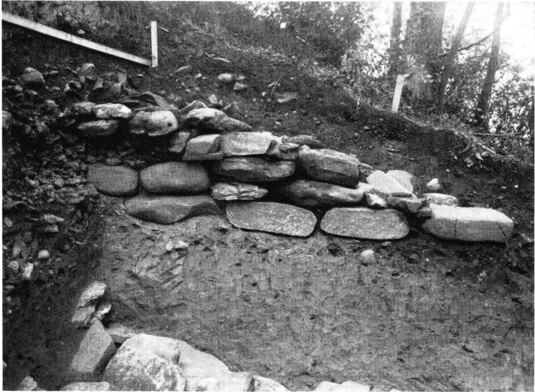
Taf. XX, Abb. 1. Oberriet, Montlingerberg In der Mitte das Nordende der späthallstädtischen Wallmauer (S. 120)