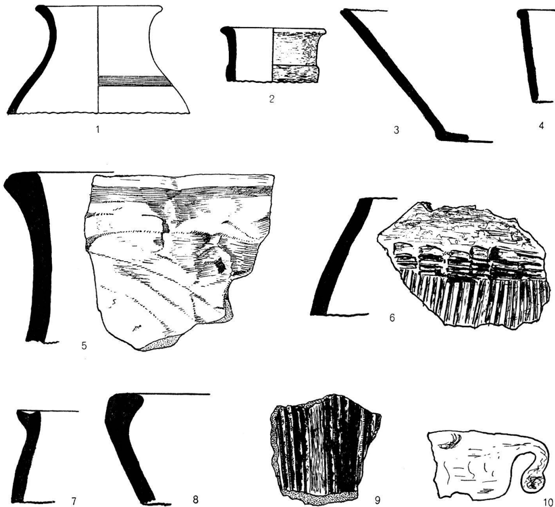
Abb.31. Rorschacherberg, Obere Burg. Funde der Spätlatènezeit. 1, 2, 7: \frac{1}{4} Gr., 3–6, 8–10: \frac{1}{2} Gr.

zeigt als ein Beispiel unter mehreren Stücken eine breite, lappenförmige Knubbe auf einer Leiste aufsitzend, deren Verzierung über den Rand der Knubbe weiterläuft. Bei Abb. 30, 1, dient eine solche Leiste als oberer Ansatzpunkt für einen Henkel. Das