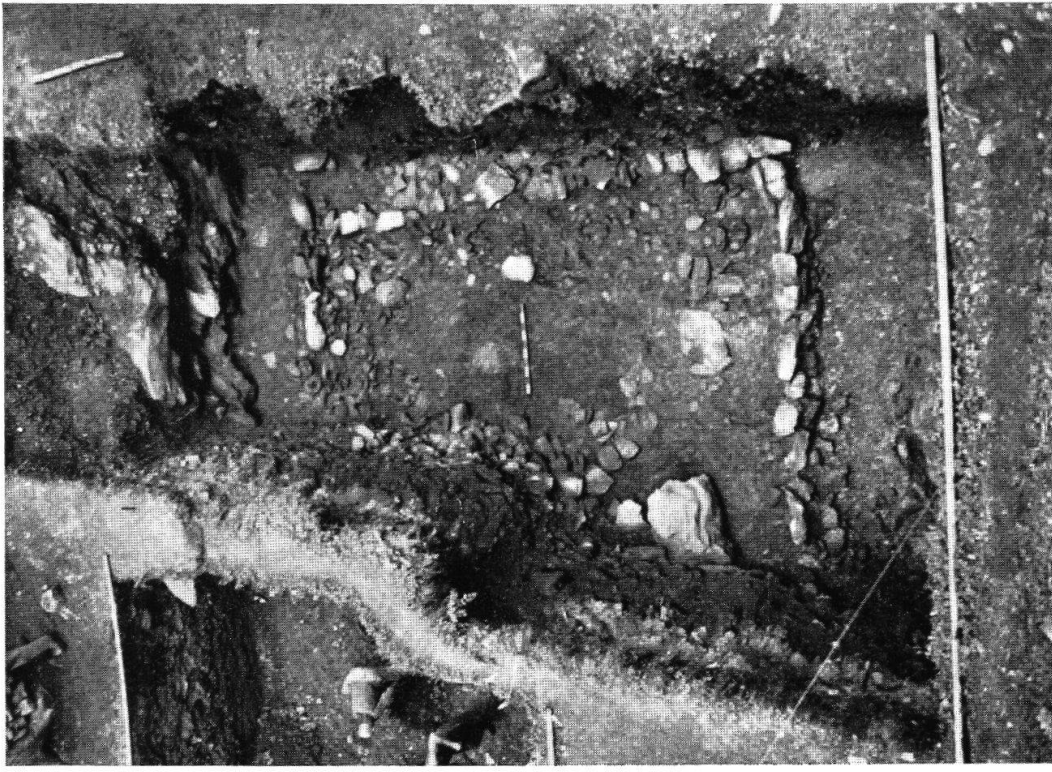
Taf. XXI, Abb. 2. Cazis-Cresta Teil eines frühbronzezeitlichen Hausgrundrisses (S. 118)