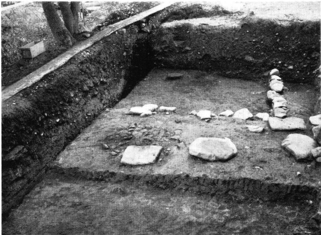
Taf. XX, Abb. 2 Oberriet, Montlingerberg. Hausecke des späten Hallstatthorizontes (S. 120)