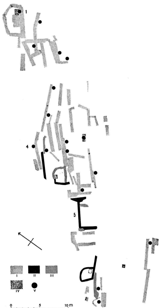
Abb. 1. Castaneda GR: Steinsetzungen der oberen Hangterrasse. I Trockenmauern und Steinsetzungen ohne Überschneidungen; II Überschneidungen, obere Schicht; III Überschneidungen, untere Schicht; IV Feuerstellen; V Keramikfunde.

bungskampagne eine Scherbengruppe stammt. Selbst diese beschränkte Zuordnungsmöglichkeit vermag aber Aufschlüsse zu vermitteln, welche eine Neuinterpretation der Befunde rechtfertigen.