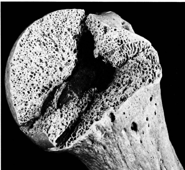
Abb. 2 Linker Humeruskopf mit eingelagertem Pfeileisen Individuum 32 (Streufund 3), ca. 2× natürliche Grösse

Die Einlagerung eines Metallfremdkörpers in Knochengewebe, ohne dass dabei aussen traumatische Läsionen festzustellen wären, ist bemerkens-