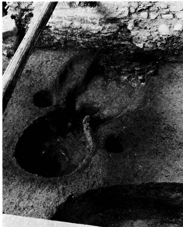
Fig. 15. Genève GE, Rue du Cloître. Four de potier de La Tène finale.

Rue du Cloître. CN 1301, 400 410/117 430. – Sur la colline, au nord de la Genève antique, les fouilles ont révélé les vestiges d'un atelier de potier datés de La Tène finale. Le four présentait une fosse circulaire dont les parois étaient renforcées à l'aide d'un enduit (fig. 15). Un élément central supportait la