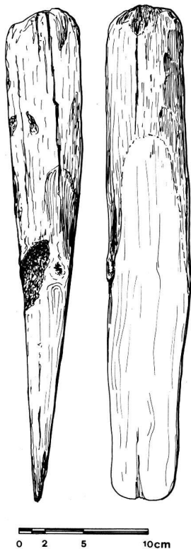
Fig. 27. Yverdon VD, St-Roch. Coin en chêne. Epoque de La Tène (?). Dessin M. Klausener.

Les pieux sont implantés à la cote 430.00 (plus ou moins 20 cm) dans un niveau de sables limoneux bruns, surmontant un mince niveau tourbeux, contenant de nombreux restes végétaux, des bois flottés