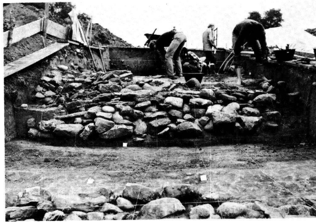
Fig. 26. Bas Vully FR, Clos Risold. Sondage 32 (campagne 1981). Une portion du front du deuxième rempart (vue de l'Ouest): au premier plan, les pierres du parement externe, au centre, les pierres en négatif du parement interne; on distingue de part et d'autre du tronçon dégagé l'emplacement de 2 pieux en chêne, à gauche un mur perpendiculaire appuyé sur le parement interne (fils équidistants de 50 cm).

L'activité de ces 2 dernières campagnes fut principalement orientée vers l'analyse du deuxième rempart , reconnu en 1978 (fossés et fosses) et en 1979 (niveau de construction, remblais de la rampe, couche d'occupation) associée à l'étude de la problématique relative à la fin de la période de La Tène (fin 2 e -1 er s. av. J.-C.) qui s'y rattache. Le rempart fut coupé à 4 reprises jusqu'au fossé, 3 tranchées furent complétées par une extension en surface, limitée, de manière à pouvoir étudier le mode de construction du front du rempart. Les observations les plus claires ont été effectuées en 1981 sur la butte située au sud du chemin vicinal (voir ASSPA 64, 1981, 158): précédé d'un fossé au fond plat, d'une pente abrupte et d'une berme aménagées dans la molasse sous-jacente, le front se compose d'un parement externe de pierres sèches, disposé par tronçons entre des pieux de chêne (diam. 0,5-0,9 m) soit un « Pfostenschlitzmauer »; le remplissage arrière est exclusivement composé dans la partie basse de sable et limon, sans aucune trace d'armature en bois, du moins sur la hauteur conservée (max. 0,8 m); un parement du même type est aménagé dans la partie interne du front. Un autre tronçon de mur du même type vient en outre s'appuyer contre un pieu du parement interne et délimite ainsi un espace «occupé» jusqu'à un petit fossé, situé à env. 4 m du mur, creusé à la surface d'une série de